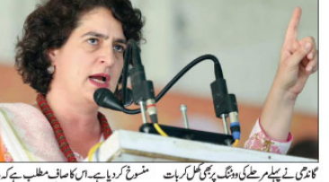
پی جے پی کے حوصلے پست ہو گئے ہیں: کانگریس جنرل سکریٹری نے کہا کہ امیدواروں کے لئے یہ ایک نیا سنہری باب ہے۔ اس آپریشن میں ملک کی فوجی تاریخ کا ایک سنہری باب ہے۔ اس آپریشن میں ملک کی فوجی تاریخ کا ایک سنہری باب ہے۔ اس آپریشن میں ملک کی فوجی تاریخ کا ایک سنہری باب ہے۔

مہم توقعات سے بہتر کر رہے ہیں، پہلا مرحلہ مہمانہ لیا گیا تھا، عوامی رجحانات سے پی جے پی کے حوصلے پست ہو گئے ہیں: کانگریس جنرل سکریٹری