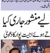
بنگال: مذہبی امتحان کے نتائج کا اعلان جلد ہونے کا امکان: 22 اپریل (پرائیویٹ) 2024 میں بی بی پی امیدواروں کے نتائج کا اعلان جلد ہونے کا امکان۔ اس آپریشن میں ملک کی فوجی تاریخ کا ایک سنہری باب ہے۔ اس آپریشن میں ملک کی فوجی تاریخ کا ایک سنہری باب ہے۔

22 اپریل (پرائیویٹ) 2024 میں بی بی پی امیدواروں کے نتائج کا اعلان جلد ہونے کا امکان