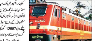
کھنڈ میں کسانوں کی جاری تحریک کی وجہ سے ٹریبونل کارخانہ موڑا گیا۔ کسانوں کی جاری تحریک کی وجہ سے ٹریبونل کارخانہ موڑا گیا۔

کسانوں کی جاری تحریک کی وجہ سے ٹریبونل کارخانہ موڑا گیا۔ کسانوں کی جاری تحریک کی وجہ سے ٹریبونل کارخانہ موڑا گیا۔