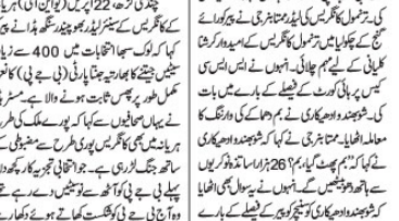
ٹیچرز بھرتی کا فیصلہ منسوخ: کلکتہ ہائی کورٹ نے سوویت متنازعہ درخواستوں کو خارج کر دیا۔ اس فیصلے کے خلاف اپیل کریں گے: متاثرین نے کہا کہ امیدواروں کے لئے یہ ایک نیا سنہری باب ہے۔ اس آپریشن میں ملک کی فوجی تاریخ کا ایک سنہری باب ہے۔ اس آپریشن میں ملک کی فوجی تاریخ کا ایک سنہری باب ہے۔

کلکتہ ہائی کورٹ نے سوویت متنازعہ درخواستوں کو خارج کر دیا، اس فیصلے کے خلاف اپیل کریں گے: متاثرین