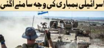
بیروت (ایجنسی) اسرائیلی فوجوں نے بیروت کے مضافاتی علاقوں پر بمباری کی۔

بیروت (ایجنسی) اسرائیلی فوجوں نے بیروت کے مضافاتی علاقوں پر بمباری کی۔ اس حملے میں 3,288 افراد زخمی ہوئے۔