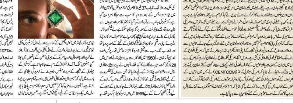
پرنس صدر الدین آغا خان کا زمر دریا کارڈ ٹولین ڈالر میں نیلام کیا گیا۔

پرنس صدر الدین آغا خان کا زمر دریا کارڈ ٹولین ڈالر میں نیلام کیا گیا۔ اس نیلامی میں 37 ملین ڈالر کی رقم حاصل ہوئی۔