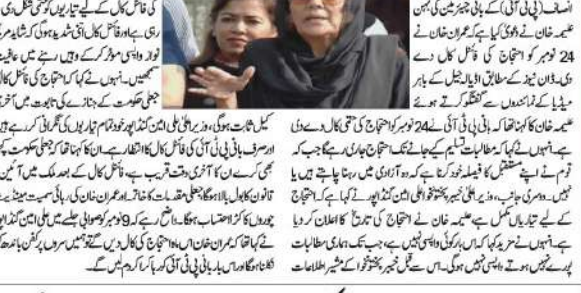
عمران خان نے 24 نومبر کو احتجاج کی فائل کال دے دی، علیہ خان کا دعویٰ کیا ہے۔