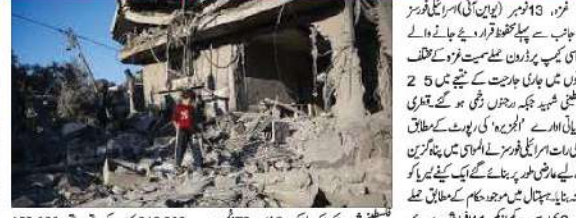
فوز، 13 نومبر (ایران آئی) اسرائیلی فوجوں نے غزہ میں پناہ گزین کیمپوں پر حملے میں 25 فلسطینی شہید کیے۔

اقوام متحدہ کی غزہ میں 50,000 سے زائد بچوں کے فوری علاج میں مدد کی اپیل