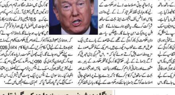
ڈونلڈ ٹرمپ نے مسک اور راماسوامی کو بڑی ذمہ داری سونپی۔

ڈونلڈ ٹرمپ نے مسک اور راماسوامی کو بڑی ذمہ داری سونپی۔ اس منصوبے کے تحت سرکاری بیوروکریسی کو ختم کرنے کا ارادہ رکھتا ہے۔