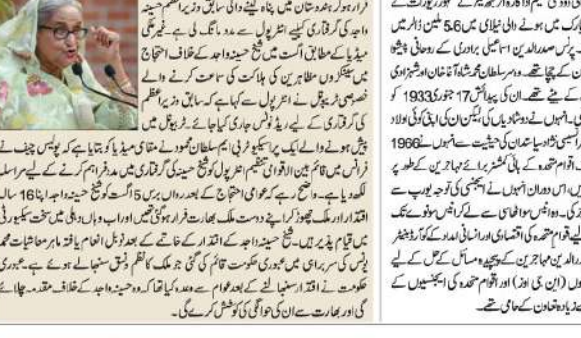
بنگلہ دیش نے حسینہ واجد کی گرفتاری کیلئے انٹربول سے مدد مانگی۔

بنگلہ دیش نے حسینہ واجد کی گرفتاری کیلئے انٹربول سے مدد مانگی۔ اس کیلئے انٹربول سے مدد مانگی گئی ہے۔