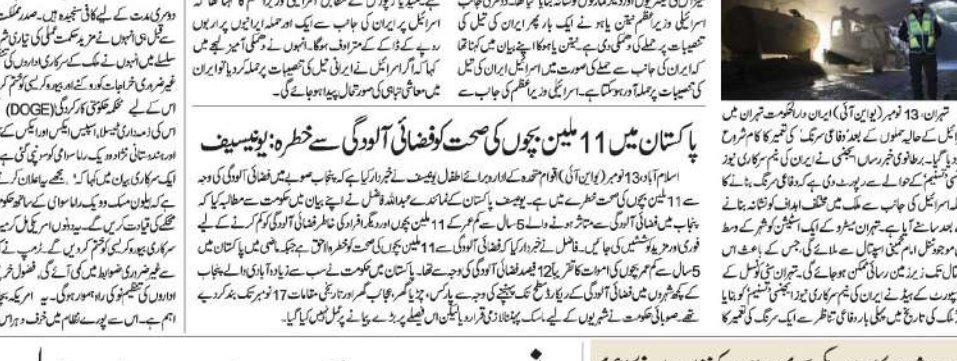
تہران میں دفاعی سرنگ کی تعمیر شروع کی گئی ہے۔

تہران میں دفاعی سرنگ کی تعمیر شروع کی گئی ہے۔ اس سرنگ کی تعمیر میں 11 بلین بچوں کی صحت کو فضا کی آلودگی سے خطرہ ہے۔