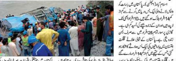
اسلام آباد (ایجنسی) پاکستان میں بارہا تیل کی بس حادثے کا شکار ہونے لگی ہے۔

اسلام آباد (ایجنسی) پاکستان میں بارہا تیل کی بس حادثے کا شکار ہونے لگی ہے۔ اس حادثے میں 14 افراد ہلاک ہوئے۔