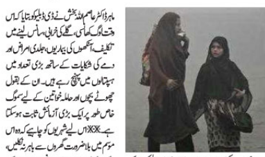
لاہور اور ملتان میں سموگ کی وجہ سے ہیلیکوپٹر جنسی کی حالت خطرناک ہو گئی ہے۔

لاہور اور ملتان میں سموگ کی وجہ سے ہیلیکوپٹر جنسی کی حالت خطرناک ہو گئی ہے۔ سموگ کی وجہ سے ہیلیکوپٹر جنسی کی حالت خطرناک ہو گئی ہے۔ سموگ کی وجہ سے ہیلیکوپٹر جنسی کی حالت خطرناک ہو گئی ہے۔