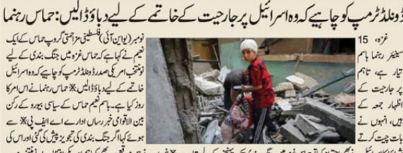
غزہ (بجٹی) فلسطین کے صوبائی قیام میں ہے۔ ٹریمپ نے کہا ہے کہ وہ غزہ میں جاری جنگ بندی کے لیے تیار ہیں اور انہوں نے ٹریمپ سے اسرائیل پر دباؤ ڈالنے کا مطالبہ کیا ہے۔

غزہ (بجٹی) فلسطین کے صوبائی قیام میں ہے۔ ٹریمپ نے کہا ہے کہ وہ غزہ میں جاری جنگ بندی کے لیے تیار ہیں اور انہوں نے ٹریمپ سے اسرائیل پر دباؤ ڈالنے کا مطالبہ کیا ہے۔ اسرائیلی حکومت پر چارجیت کے خاتمے کے لیے دباؤ ڈالنے کا مطالبہ کیا گیا ہے۔ اسرائیلی حکومت پر چارجیت کے خاتمے کے لیے دباؤ ڈالنے کا مطالبہ کیا گیا ہے۔ اسرائیلی حکومت پر چارجیت کے خاتمے کے لیے دباؤ ڈالنے کا مطالبہ کیا گیا ہے۔