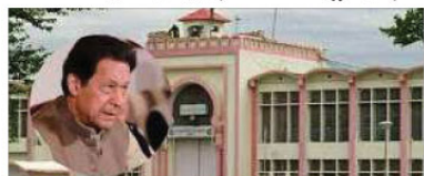
پاکستانی حکومت نے عمران خان کی رہائی کے لیے امریکی ارکان کانگریس کو ایک اور خط ارسال کیا ہے۔

اسلام آباد (بجٹی)۔ ۱۹ نومبر کو پاکستانی حکومت نے عمران خان کی رہائی کے لیے امریکی ارکان کانگریس کو ایک اور خط ارسال کیا ہے۔ خط میں عمران خان کی رہائی کے لیے امریکی حکومت پر دباؤ ڈالنے کا مطالبہ کیا گیا ہے۔ خط میں عمران خان کی رہائی کے لیے امریکی حکومت پر دباؤ ڈالنے کا مطالبہ کیا گیا ہے۔