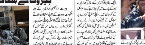
ٹریمپ کا بیٹن میں اسرائیل کے کامیوں کی تقریر پر امریکی مسلمان ناراض ہیں۔

ٹریمپ کا بیٹن میں اسرائیل کے کامیوں کی تقریر پر امریکی مسلمان ناراض ہیں۔ ٹریمپ کا بیٹن میں اسرائیل کے کامیوں کی تقریر پر امریکی مسلمان ناراض ہیں۔