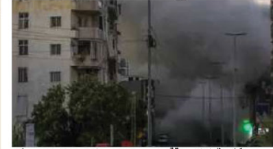
غزہ (بجٹی) فلسطین کے صوبائی قیام میں ہے۔ ٹریمپ نے کہا ہے کہ وہ غزہ میں جاری جنگ بندی کے لیے تیار ہیں اور انہوں نے ٹریمپ سے اسرائیل پر دباؤ ڈالنے کا مطالبہ کیا ہے۔

غزہ (بجٹی) فلسطین کے صوبائی قیام میں ہے۔ ٹریمپ نے کہا ہے کہ وہ غزہ میں جاری جنگ بندی کے لیے تیار ہیں اور انہوں نے ٹریمپ سے اسرائیل پر دباؤ ڈالنے کا مطالبہ کیا ہے۔ اسرائیلی حکومت پر چارجیت کے خاتمے کے لیے دباؤ ڈالنے کا مطالبہ کیا گیا ہے۔ اسرائیلی حکومت پر چارجیت کے خاتمے کے لیے دباؤ ڈالنے کا مطالبہ کیا گیا ہے۔ اسرائیلی حکومت پر چارجیت کے خاتمے کے لیے دباؤ ڈالنے کا مطالبہ کیا گیا ہے۔