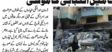
اسرائیلی فوج نے لبنان سے داغے دو روز کو مارا گیا ہے۔

اسرائیلی فوج نے لبنان سے داغے دو روز کو مارا گیا ہے۔ اسرائیلی فوج نے لبنان سے داغے دو روز کو مارا گیا ہے۔ اسرائیلی فوج نے لبنان سے داغے دو روز کو مارا گیا ہے۔