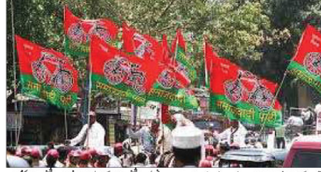
پارٹی کے لیڈر نے کہا ہے کہ مسلم آبادی کے 65 فیصد سے زیادہ علاقوں میں ہار گئی سپا۔ انڈیا کے ایک بڑے پارٹی کے لیڈر نے کہا ہے کہ مسلم آبادی کے 65 فیصد سے زیادہ علاقوں میں ہار گئی سپا۔

دہلی 24 نومبر (بی این ایس) انڈیا کے ایک بڑے پارٹی کے لیڈر نے کہا ہے کہ مسلم آبادی کے 65 فیصد سے زیادہ علاقوں میں ہار گئی سپا۔ انڈیا کے ایک بڑے پارٹی کے لیڈر نے کہا ہے کہ مسلم آبادی کے 65 فیصد سے زیادہ علاقوں میں ہار گئی سپا۔ انڈیا کے ایک بڑے پارٹی کے لیڈر نے کہا ہے کہ مسلم آبادی کے 65 فیصد سے زیادہ علاقوں میں ہار گئی سپا۔ انڈیا کے ایک بڑے پارٹی کے لیڈر نے کہا ہے کہ مسلم آبادی کے 65 فیصد سے زیادہ علاقوں میں ہار گئی سپا۔ انڈیا کے ایک بڑے پارٹی کے لیڈر نے کہا ہے کہ مسلم آبادی کے 65 فیصد سے زیادہ علاقوں میں ہار گئی سپا۔