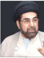
پاکستان کے پارلیمان میں شیعوں کا قتل عام اعلان دہشت گردی ہے۔ انڈیا کے ایک بڑے پارٹی کے لیڈر نے کہا ہے کہ مسلم آبادی کے 65 فیصد سے زیادہ علاقوں میں ہار گئی سپا۔

مولانا نے انٹرویو میں کہا کہ پاکستان کے پارلیمان میں شیعوں کا قتل عام اعلان دہشت گردی ہے۔ انڈیا کے ایک بڑے پارٹی کے لیڈر نے کہا ہے کہ مسلم آبادی کے 65 فیصد سے زیادہ علاقوں میں ہار گئی سپا۔