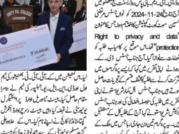
جسٹس مرتضیٰ حسین موٹ کورٹ کمپین کا اختتام کے دوران ایک لمحہ۔

جسٹس مرتضیٰ حسین موٹ کورٹ کمپین کا اختتام ہو گیا۔ تقریب میں بڑے پیمانے پر شریکین شرکت کیے۔