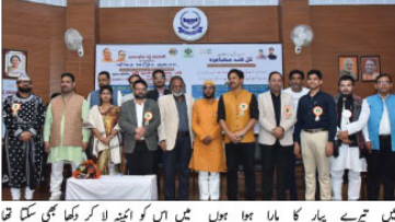
اتر پردیش اردو کادی اور مسعودی غریب نواز سوسائٹی کے زیر اہتمام کل ہند مشاعرے کے دوران ایک لمحہ۔

کل ہند مشاعرے کے زیر اہتمام اردو کادی اور مسعودی غریب نواز سوسائٹی نے ایک اہم تقریب منعقد کی۔ تقریب میں بڑے پیمانے پر شریکین شرکت کیے۔