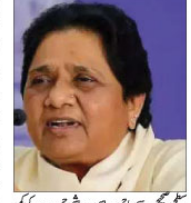
یاتری نے کہا کہ آئین ہندوستان کی بنیاد روح اور احترام کے لیے ہے۔

مرکزی میں رہی حکومتوں نے آئین صحیح سے نافذ نہیں کیا: یاتری۔ مرکزی میں رہی حکومتوں نے آئین صحیح سے نافذ نہیں کیا: یاتری۔ مرکزی میں رہی حکومتوں نے آئین صحیح سے نافذ نہیں کیا: یاتری۔