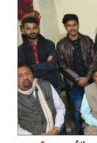
نشست میں شاعری کے موضوع پر گفتگو کی گئی۔ نشست میں شاعری کے موضوع پر گفتگو کی گئی۔

دبستان اہل قلم لکھنؤ کے تحت اعزازی شعری نشست۔ نشست میں شاعری کے موضوع پر گفتگو کی گئی۔ دبستان اہل قلم لکھنؤ کے تحت اعزازی شعری نشست۔ نشست میں شاعری کے موضوع پر گفتگو کی گئی۔ دبستان اہل قلم لکھنؤ کے تحت اعزازی شعری نشست۔ نشست میں شاعری کے موضوع پر گفتگو کی گئی۔