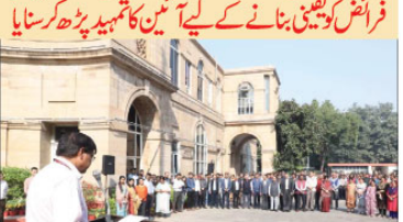
ریلوے والوں نے ملک کے اتحاد اور سالمیت اور بنیادی فرسخ کو یقینی بنانے کے لیے آئین کا تمہید پڑھ کر سنایا۔

ریلوے والوں نے ملک کے اتحاد اور سالمیت اور بنیادی فرسخ کو یقینی بنانے کے لیے آئین کا تمہید پڑھ کر سنایا۔ ریلوے والوں نے ملک کے اتحاد اور سالمیت اور بنیادی فرسخ کو یقینی بنانے کے لیے آئین کا تمہید پڑھ کر سنایا۔ ریلوے والوں نے ملک کے اتحاد اور سالمیت اور بنیادی فرسخ کو یقینی بنانے کے لیے آئین کا تمہید پڑھ کر سنایا۔