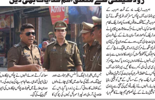
اروہہ ٹریفک کے تحت اروہہ کے سپرنٹنڈنٹ آف پولیس سز کوٹوالہ نے اروہہ ٹریفک نظام کا جائزہ لیا۔