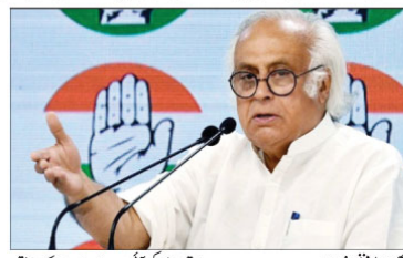
ایگزیکٹو جی ایس ٹی کی میٹنگ 30 نومبر (پانچ بجے) کو ہوگی۔ جی ایس ٹی کی میٹنگ 21 دسمبر کو ہونے کے خلاف احتجاجی مظاہرے کیے جا رہے ہیں۔

نئی دہلی: ایگزیکٹو جی ایس ٹی کی میٹنگ 30 نومبر (پانچ بجے) کو ہوگی۔ جی ایس ٹی کی میٹنگ 21 دسمبر کو ہونے کے خلاف احتجاجی مظاہرے کیے جا رہے ہیں۔ جی ایس ٹی کی میٹنگ 21 دسمبر کو ہونے کے خلاف احتجاجی مظاہرے کیے جا رہے ہیں۔