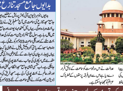
سپریم کورٹ میں مذہبی عبادت گاہوں کے تحفظ کے قانون کی آئینی حیثیت پر سماعت کی گئی۔

مذہبی عبادت گاہوں کے تحفظ کے قانون کی آئینی حیثیت پر 4 دسمبر کو سپریم کورٹ میں سماعت مذہبی عبادت گاہوں کے تحفظ کے قانون کی آئینی حیثیت پر 4 دسمبر کو سپریم کورٹ میں سماعت کی گئی۔ اس فیصلے سے ملک بھر میں مذہبی عبادت گاہوں کے تحفظ کے قانون کی آئینی حیثیت پر 4 دسمبر کو سپریم کورٹ میں سماعت کی گئی۔