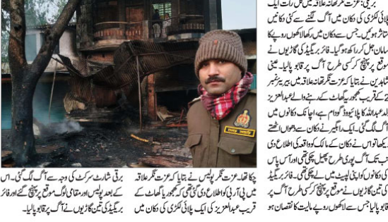
پلا سیووڈ کی دکان میں شارٹ سرکٹ سے لگی آگ۔ آگ نے دکان کے سامنے والے حصے کو تباہ کر دیا۔