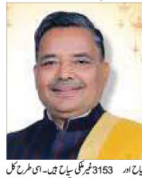
جیو پرسنگھ سیاحوں کی تعداد 47.61 کروڑ اور غیر ملکی سیاحوں کی تعداد 14 لاکھ سے اوپر

پچھلے دو مہینوں میں 47.61 کروڑ سیاح اتر پردیش آئے ملکی سیاحوں کی تعداد 47.47 کروڑ اور غیر ملکی سیاحوں کی تعداد 14 لاکھ سے اوپر