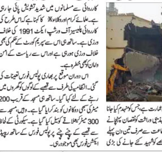
Nuri Masjid in Lucknow

ہائی کورٹ میں سماعت سے پہلے نوری جامع مسجد پر انتظامیہ کی بڑی کارروائی مسجد شہید کئے جانے سے مسلمانوں میں تشویش!