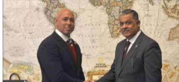
واشنگٹن (اے پی پی)۔ پاکستان کی سیاسی تقسیم کا دائرہ امریکا تک پھیل گیا۔

پاکستان کی سیاسی تقسیم کا دائرہ امریکا تک پھیل گیا۔