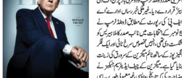
واشنگٹن (اے پی پی)۔ ٹائم میگزین نے ڈونلڈ ٹرمپ کو دوسری بار پرن آف دی ایئر قرار دیا۔