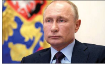
واشنگٹن (اے پی پی)۔ روس کے صدر ولادیمیر پوتن نے کہا ہے کہ شام میں تختہ پلٹ کے لیے امریکہ اور اسرائیل ہی ذمہ دار ہیں۔