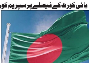
واشنگٹن (اے پی پی)۔ بنگلہ دیش کی عدالت نے کہا ہے کہ بنگلہ دیش کا قومی نعرہ نہیں ہوگا۔