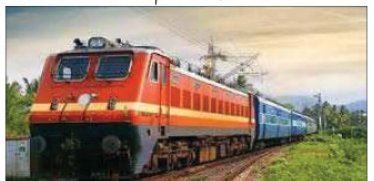
نارتھ ایسٹرن ریلوے کی ایک ٹرین۔

نارتھ ایسٹرن ریلوے پرموڈ آفیسرز ایسوسی ایشن کی سالانہ جنرل باڈی میٹنگ منعقد ہوئی۔