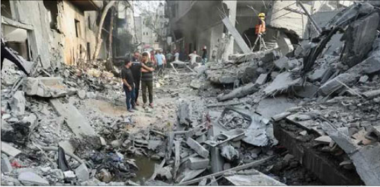
غزہ (اے پی پی)۔ فلسطینیوں نے کہا ہے کہ اسرائیلی فضائی حملے میں 25 فلسطینی جاں بحق اور درجنوں زخمی ہوئے۔

غزہ (اے پی پی)۔ فلسطینیوں نے کہا ہے کہ اسرائیلی فضائی حملے میں 25 فلسطینی جاں بحق اور درجنوں زخمی ہوئے۔ فلسطینیوں نے کہا ہے کہ اسرائیلی فضائی حملے میں 25 فلسطینی جاں بحق اور درجنوں زخمی ہوئے۔