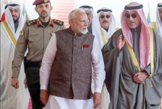
ہندو اور کویت کے درمیان تعلقات تہذیبیہ، ہندو اور تجارت سے عمارت ہے، پی ایم مودی نے کویت میں ہلال مودی پروگرام میں بھارتی برادری سے خطاب کیا