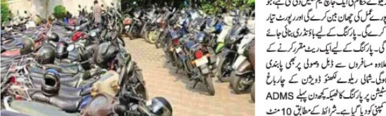
تفصیلاً جانچ کیلئے تشکیل دی گئی جانچ ٹیم کے افسران کی طرف سے پارکنگ کے تنازعہ کو ختم کرنے کے لیے جانچ کی گئی ہے۔

نارتھ اور فارتھ ایسٹرن ریلوے کے افسران کریں گے جانچ