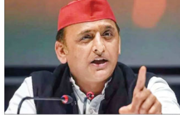
قائد کوہنہ سنگھ کی نیشنل پارٹی کے بی جے پی حکومت نے آئی ایم اے اور لوکر کو روکا ہے اور وہ آئین کی راد پر کلان ہے۔ کلان جیٹ کی صورت میں حکومت نے بی جے پی کی حکومت کو روکا ہے اور وہ آئین کی راد پر کلان ہے۔ کلان جیٹ کی صورت میں حکومت نے بی جے پی کی حکومت کو روکا ہے اور وہ آئین کی راد پر کلان ہے۔

منموہن سنگھ، نگہبانی یونٹوں نے کہا بی جے پی اپنی سوچ کی غیر مناسب مثال پیش نہ کرے، یادگار صرف راج گھاٹ پر ہی بنانا چاہیے