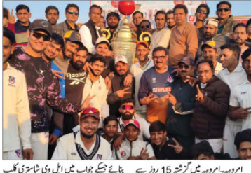
مراد آباد کی ایک لاکھ اکیس ہزار اور شاندار ثرافی ہوئی حاصل

کامیابی حاصل کر لی۔ تین ماہ کے امتحان کے بعد مراد آباد کے بھائیوں کو ماری گولی کی واردات ہوئی۔ تین بھائیوں کو ماری گولی کی واردات ہوئی۔ تین بھائیوں کو ماری گولی کی واردات ہوئی۔ تین بھائیوں کو ماری گولی کی واردات ہوئی۔