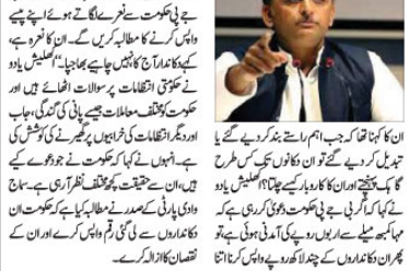
مہا کبھی میں نقصان اٹھانے والے کانداروں کو معاوضہ دینے کا مطالبہ کیا۔ انہوں نے کہا کہ کانداروں کو معاوضہ دینے کا مطالبہ کیا جائے گا۔

مہا کبھی میں نقصان اٹھانے والے کانداروں کو معاوضہ دینے کا مطالبہ کیا۔ انہوں نے کہا کہ کانداروں کو معاوضہ دینے کا مطالبہ کیا جائے گا۔ انہوں نے کہا کہ کانداروں کو معاوضہ دینے کا مطالبہ کیا جائے گا۔ انہوں نے کہا کہ کانداروں کو معاوضہ دینے کا مطالبہ کیا جائے گا۔ انہوں نے کہا کہ کانداروں کو معاوضہ دینے کا مطالبہ کیا جائے گا۔