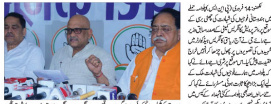
پلوامہ کے شہداء کی شہادت رائیگاں نہیں جائے گی۔ بے رائے نے کہا کہ شہداء کی شہادت کو فراموش نہیں کیا جائے گا۔

بے رائے نے کہا کہ پلوامہ کے شہداء کی شہادت کو فراموش نہیں کیا جائے گا۔ انہوں نے کہا کہ شہداء کی شہادت کو فراموش نہیں کیا جائے گا۔ انہوں نے کہا کہ شہداء کی شہادت کو فراموش نہیں کیا جائے گا۔ انہوں نے کہا کہ شہداء کی شہادت کو فراموش نہیں کیا جائے گا۔ انہوں نے کہا کہ شہداء کی شہادت کو فراموش نہیں کیا جائے گا۔