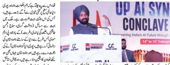
وزیر اعظم مودی نے اے آئی پر کی عالمی قیادت کی تعریف کی۔ انہوں نے کہا کہ ہندوستان کی بصیرت انگیز نقطہ نظر کی تعریف کی جاتی ہے۔

وزیر اعظم مودی نے اے آئی پر کی عالمی قیادت کی تعریف کی۔ انہوں نے کہا کہ ہندوستان کی بصیرت انگیز نقطہ نظر کی تعریف کی جاتی ہے۔ انہوں نے کہا کہ ہندوستان کی بصیرت انگیز نقطہ نظر کی تعریف کی جاتی ہے۔ انہوں نے کہا کہ ہندوستان کی بصیرت انگیز نقطہ نظر کی تعریف کی جاتی ہے۔ انہوں نے کہا کہ ہندوستان کی بصیرت انگیز نقطہ نظر کی تعریف کی جاتی ہے۔