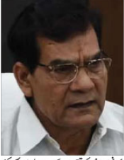
کھننوج میں لڑائی لڑی این ایس اے کے سربراہ کی مدد سے ایک مہاکمبہ کو اپنے لیے ایک موقع کے طور پر دیکھا۔

کھننوج میں لڑائی لڑی این ایس اے کے سربراہ کی مدد سے ایک مہاکمبہ کو اپنے لیے ایک موقع کے طور پر دیکھا۔ اتر پردیش کے بی جے پی نے مہاکمبہ کو اپنے لیے ایک موقع کے طور پر دیکھا۔ اتر پردیش کے بی جے پی نے مہاکمبہ کو اپنے لیے ایک موقع کے طور پر دیکھا۔ کھننوج میں لڑائی لڑی این ایس اے کے سربراہ کی مدد سے ایک مہاکمبہ کو اپنے لیے ایک موقع کے طور پر دیکھا۔ اتر پردیش کے بی جے پی نے مہاکمبہ کو اپنے لیے ایک موقع کے طور پر دیکھا۔ اتر پردیش کے بی جے پی نے مہاکمبہ کو اپنے لیے ایک موقع کے طور پر دیکھا۔