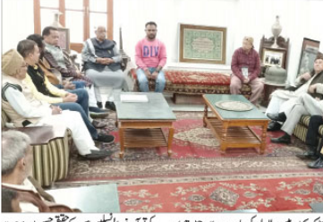
کھننوج میں لڑائی لڑی این ایس اے کے سربراہ کی مدد سے ایک مہاکمبہ کو اپنے لیے ایک موقع کے طور پر دیکھا۔

کھننوج میں لڑائی لڑی این ایس اے کے سربراہ کی مدد سے ایک مہاکمبہ کو اپنے لیے ایک موقع کے طور پر دیکھا۔ اتر پردیش کے بی جے پی نے مہاکمبہ کو اپنے لیے ایک موقع کے طور پر دیکھا۔ اتر پردیش کے بی جے پی نے مہاکمبہ کو اپنے لیے ایک موقع کے طور پر دیکھا۔ کھننوج میں لڑائی لڑی این ایس اے کے سربراہ کی مدد سے ایک مہاکمبہ کو اپنے لیے ایک موقع کے طور پر دیکھا۔ اتر پردیش کے بی جے پی نے مہاکمبہ کو اپنے لیے ایک موقع کے طور پر دیکھا۔ اتر پردیش کے بی جے پی نے مہاکمبہ کو اپنے لیے ایک موقع کے طور پر دیکھا۔