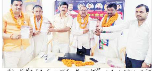
کام کر رہی ہے اور ساتھ ہی ریاست میں ہم دیکھیں۔ مہرا۔ پاسوان کی سب سے بڑی کامیابی ہے۔

پاسوان کی کمان کو سونپے گئے کاغذات نامزدگی کے لیے۔ اس موقع پر ریاست کی تمام سیٹیں جیتنے کی یقین دہانی کی گئی۔ ریاست کی تمام سیٹیں جیتنے کی یقین دہانی کی گئی۔ ریاست کی تمام سیٹیں جیتنے کی یقین دہانی کی گئی۔