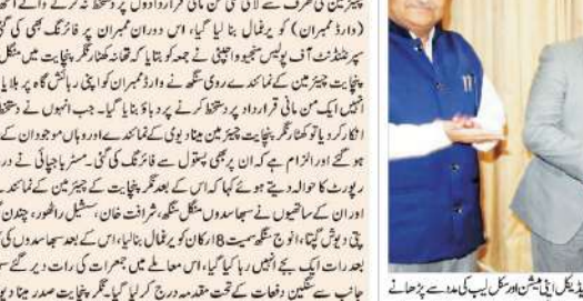
ایر امیڈیکل یونیورسٹی میں ایم بی بی ایس اسٹوڈنٹ انڈکشن اور میٹنیشن پروگرام کی افتتاحی تقریب کے دوران۔

ایر امیڈیکل یونیورسٹی میں ایم بی بی ایس اسٹوڈنٹ انڈکشن اور میٹنیشن پروگرام کی افتتاحی تقریب کے دوران۔ اس موقع پر ریاست کی تمام سیٹیں جیتنے کی یقین دہانی کی گئی۔