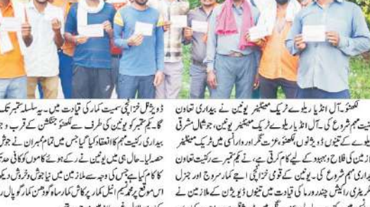
آل انڈیا ریلوے ٹریک میٹینینر یونین نے بیداری تعاون کنیت مہم شروع کی تقریب کے دوران۔

آل انڈیا ریلوے ٹریک میٹینینر یونین نے بیداری تعاون کنیت مہم شروع کی تقریب کے دوران۔ اس موقع پر ریاست کی تمام سیٹیں جیتنے کی یقین دہانی کی گئی۔