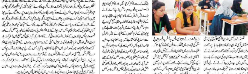
خواجہ معین الدین چشتی لیبگونگ یونیورسٹی میں قومی غذائیت کا ہفتہ کی افتتاحی تقریب کے دوران۔

خواجہ معین الدین چشتی لیبگونگ یونیورسٹی میں قومی غذائیت کا ہفتہ کی افتتاحی تقریب کے دوران۔ اس موقع پر ریاست کی تمام سیٹیں جیتنے کی یقین دہانی کی گئی۔