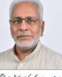
مضمون مراد آبادی