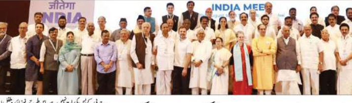
انڈیا سے جوڑ گیا وہ مر گیا