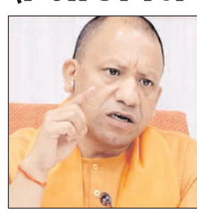
का भी शिलान्यास करेंगे। महानिदेशक, स्कूल शिक्षा विजय

लखनऊ। मुख्यमंत्री योगी आदित्यनाथ मंगलवार को 2.09 लाख शिक्षकों को टैबलेट की सौगात देंगे। वह परिषदीय स्कूलों में टैबलेट वितरण कार्य का शुभारंभ करेंगे। शिक्षक दिवस पर लोक भवन में आयोजित होने वाले समारोह में वह 18,381 स्कूलों में स्मार्ट क्लास और सभी ब्लाक संसाधन केंद्रों पर इनफार्मेशन कान्युनिकेशन टेक्नोलॉजी (आईसीटी) लैब बनाने की योजना का भी शिलान्यास करेंगे। महानिदेशक, स्कूल शिक्षा विजय