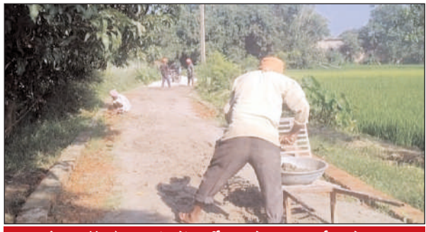
पडरौना ब्लॉक के बड़गांव में फर्जी मस्टरोल पर कार्य करते मजदूर

रोजगार सेवक द्वारा मनरेगा पोर्टल पर मस्टरोल में फर्जी हाजिर लगा फोटो अपलोड कर दिया जा रहा है। जिन मनरेगा मजदूरों की हाजिरी लगाई जा रही वह मजदूर साइट पर नहीं रहते दुसरे लोगों को खड़ा कर फोटो खींच अपलोड कर दिया जा रहा। इस तरह मनरेगा मजदूरों के हक पर ख़ाका खल जिम्मेदार रोजगार सेवक द्वारा मनरेगा मजदूरों को वह दर भर भटकने पर मजबूर किया जा रहा, मामला जनपद