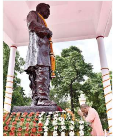
گنڈاپور، 25 ستمبر: وزیر اعلیٰ نے پنڈت دین دیال پادھیائے کی 107 ویں برسی پر ان کے مجھے پرگوشی کر کے انہیں خراج عقیدت پیش کیا۔ وزیر اعلیٰ نے پنڈت دین دیال پادھیائے کی 107 ویں برسی پر ان کے مجھے پرگوشی کر کے انہیں خراج عقیدت پیش کیا۔

گنڈاپور، 25 ستمبر: وزیر اعلیٰ پنڈت دین دیال پادھیائے کی 107 ویں برسی پر ان کے مجھے پرگوشی کر کے انہیں خراج عقیدت پیش کیا۔ وزیر اعلیٰ نے پنڈت دین دیال پادھیائے کی 107 ویں برسی پر ان کے مجھے پرگوشی کر کے انہیں خراج عقیدت پیش کیا۔ وزیر اعلیٰ نے پنڈت دین دیال پادھیائے کی 107 ویں برسی پر ان کے مجھے پرگوشی کر کے انہیں خراج عقیدت پیش کیا۔