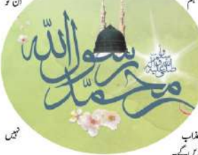
عقاب دین کے

رسول پر ہلکا اور نرمی نہیں لگتے رہے اور اپنے لیے ظلم وعدوان اور سب کو ظلم کا مظاہر کیا کہ نہ کسی کی بنا پر انہیں سے زبردست نام ہوگی مگر ان کا وہاں اور رسول کے باوجود نہ پڑا کہ نہ سب سے سختی برائے نہ ان کی استیصال الٹ پلٹ کی گئی اور نہ ان کی موت میں سزا کی گئی۔ بلکہ کفار و کفاروں کے ساتھ بھی نرمی اور شفقت کے ساتھ ہی ان کے ساتھ پہنچ کر رہا۔ یہ سب ہی کی رحمت اور شفقت ہے جو تو آسمان سے ہم عالم نے یہ اعلان فرمایا کیا: اسے محبوب بنا لیا تاکہ آپ کے زور سایہ سے ہم ان کو رحمت بظنہ کے اتنی اور تمام ہے۔