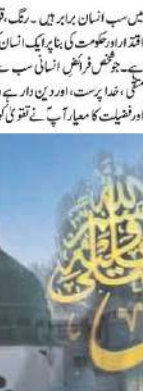
رسول اللہ صلی اللہ علیہ وسلم کی قبر

یہ بہترین مثال ہے کہ بھارت کی ہوت ہے۔ آج جب دنیا بھر پر اٹھنے لگی ہے اور دنیا کی ہر جگہ جھانپتے ہوئے ہیں، ہمیں اس موقع پر یہ سوچنا ہے کہ کس سلسلے سے ہمیں یہ نکتہ پر نظر پڑتا ہے؟ کیا ان کا پتہ گورڈر کے تحت اوراد و تہجد کو پھیلانا ہے، جس پر عمل کر کے دنیا میں ان کو ترقی کے راستہ پر گامزن ہو سکی ہے۔