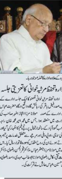
راجہ محمود آباد عظیم شخصیت اور صفات کے حامل تھے

مولانا کا انتقال ہو گیا۔ مولانا کا انتقال سے لگی ہوئی دعا پڑھی ہے کہ اس سال فرخ ساگر تھل پر واقعہ حسن کے ایک تفریحی جگہ تعمیر ہو جائے اور وہ کئی سالوں سے بہتر بن جائے۔ مولانا کا انتقال سے لگی ہوئی دعا پڑھی ہے کہ اس سال فرخ ساگر تھل پر واقعہ حسن کے ایک تفریحی جگہ تعمیر ہو جائے اور وہ کئی سالوں سے بہتر بن جائے۔