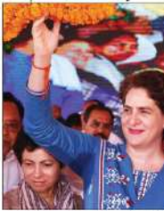
کانگریس حکومت نے قانون سازی کے لیے اپنی پالیسی کو واضح کیا ہے۔

کانگریس حکومت بنی تو کرائی جائے گی ذات پر مبنی مردم شماری کا نگرین جزل سکریٹری کا بی بی سی پر پرملہ راج بارے ہیں اب عوام کا ووٹ روزگار کے لیے ہوگا۔ کانگریس حکومت نے قانون سازی کے لیے اپنی پالیسی کو واضح کیا ہے۔