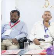
ادبی تنظیم ادارہ ادب اسلامی ہند کے زیر اہتمام ایس ایچ ایچ میں ناول 'ہست اور فرات' کے موضوع پر سمروزہ اجلاس منعقد ہوئے۔

فکشن ایسا جھوٹ ہے جس کے اندر سچ پوشیدہ ہوتا ہے: خالد جاوید۔ ادبی تنظیم ادارہ ادب اسلامی ہند کے زیر اہتمام ایس ایچ ایچ میں ناول 'ہست اور فرات' کے موضوع پر سمروزہ اجلاس منعقد ہوئے۔