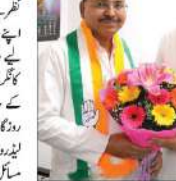
عمران پرتاپ گڑھی کی قیادت میں سینکڑوں ایس پی کارکن کانگریس میں شامل ہوئے۔