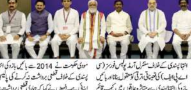
عآپ کے لیڈر نے مودی حکومت کے خلاف بیان کیا ہے۔

مودی 'انڈیا اتحاد' سے ڈرتے ہیں: عآپ۔ عآپ کے لیڈر نے مودی حکومت کے خلاف بیان کیا ہے۔