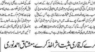
افسانہ نگار کام یہ ہے کہ وہ سماج کا عکس اس طرح پیش کرے کہ قاری مثبت اثر انداز کرے: مشتاق احمدوری

افسانہ نگار کام یہ ہے کہ وہ سماج کا عکس اس طرح پیش کرے کہ قاری مثبت اثر انداز کرے۔ مشتاق احمدوری نے کہا کہ افسانہ نگار کام یہ ہے کہ وہ سماج کا عکس اس طرح پیش کرے کہ قاری مثبت اثر انداز کرے۔ ان کا کہنا ہے کہ افسانہ نگار کام یہ ہے کہ وہ سماج کا عکس اس طرح پیش کرے کہ قاری مثبت اثر انداز کرے۔