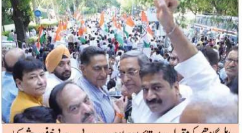
راہل گاندھی کی مقبولیت اور قدامت صلاحیت سے بی جے پی خوفزدہ: شیوکار بھگور

اگر بی جے پی میں ذرہ برابر بھی اخلاقیات باقی ہے تو انہیں سوشل میڈیا پلیٹ فارم سے قابل اعتراض پوسٹ کو ہٹا دینا چاہئے اور ملک کے عوام سے معافی مانگی جائے