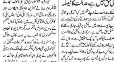
بے نظمی پر کیا حملہ

بے نظمی پر کیا حملہ ہے۔ ان کا کہنا ہے کہ بے نظمی پر کیا حملہ ہے۔ ان کا کہنا ہے کہ بے نظمی پر کیا حملہ ہے۔ ان کا کہنا ہے کہ بے نظمی پر کیا حملہ ہے۔ ان کا کہنا ہے کہ بے نظمی پر کیا حملہ ہے۔