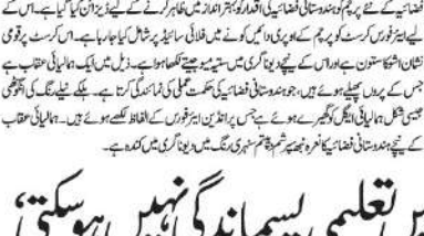
آج فضائیہ کو نیپا پر چم چم گا

آج فضائیہ کو نیپا پر چم چم گا ہے۔ ان کا کہنا ہے کہ آج فضائیہ کو نیپا پر چم چم گا ہے۔ ان کا کہنا ہے کہ آج فضائیہ کو نیپا پر چم چم گا ہے۔ ان کا کہنا ہے کہ آج فضائیہ کو نیپا پر چم چم گا ہے۔ ان کا کہنا ہے کہ آج فضائیہ کو نیپا پر چم چم گا ہے۔