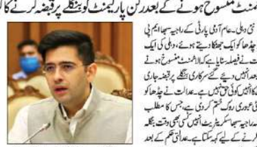
بے نظمی پر عدالتی جھٹکے کے بعد اگھو چڈھانے کی بجائے پی پر کیا حملہ

بے نظمی پر عدالتی جھٹکے کے بعد اگھو چڈھانے کی بجائے پی پر کیا حملہ ہے۔ ان کا کہنا ہے کہ بے نظمی پر عدالتی جھٹکے کے بعد اگھو چڈھانے کی بجائے پی پر کیا حملہ ہے۔ ان کا کہنا ہے کہ بے نظمی پر عدالتی جھٹکے کے بعد اگھو چڈھانے کی بجائے پی پر کیا حملہ ہے۔