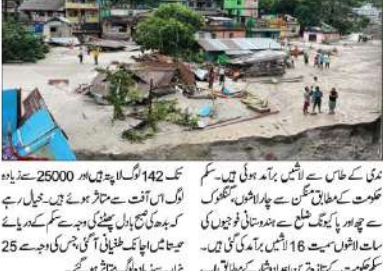
سکرم میں سیلاب سے اب تک 56 افراد ہلاک

3 ہزار سیاح چھین گئے ہیں، اچانک طغیانی کی وجہ سے 25 ہزار سے زیادہ لوگ متاثر