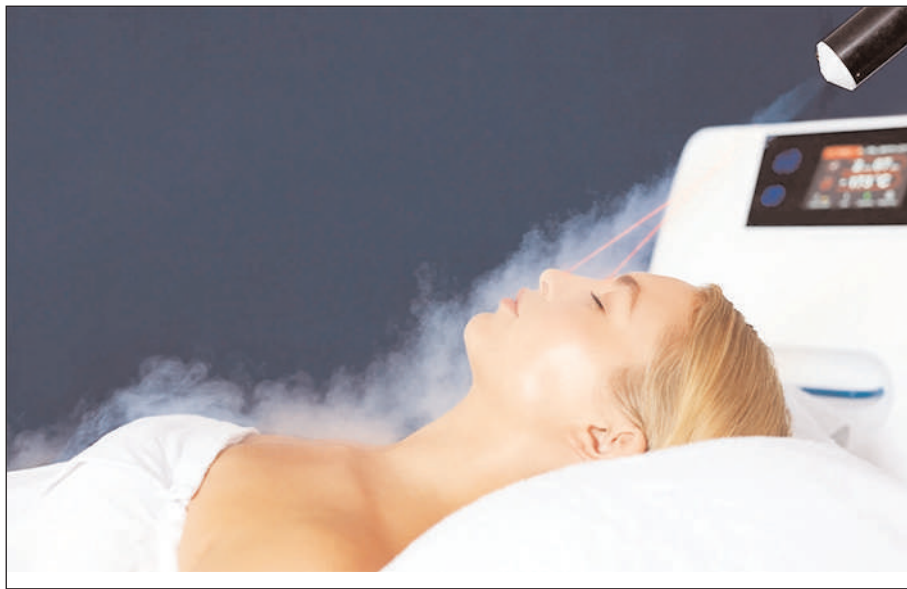
बेदाग रखने के लिए क्रायोथेरेपी का उपयोग करती हैं। आज इस आर्टिकल के जरिए हम आपको बताते जा रहे हैं कि क्रायोथेरेपी से कैसे होता है और इसको करने के क्या फायदे होते हैं।

हॉलीवुड की ज्यादातर अभिनेत्रियां जवां बने रहने तथा स्किन को बेदाग रखने के लिए क्रायोथेरेपी का उपयोग करती हैं। हम आपको बताते जा रहे हैं कि क्रायोथेरेपी से कैसे होता है और इसको करने के क्या फायदे होते हैं। अगर आप भी मांसपेशियों की समस्या से जूझ रहे हैं, तो ऐसे में आपको डॉक्टर से क्रायोथेरेपी के बारे में बात करना चाहिए। बता दें कि इस थेरेपी का इस्तेमाल शरीर की मांसपेशियों के खिंचने और ऊतकों के कमजोर होने पर किया जाता है। इस थेरेपी में व्यक्ति को काफी कम तापमान में रखा जाता है। इसको आइस पैक थेरेपी या क्रायो सर्जरी के नाम से भी जानते हैं।