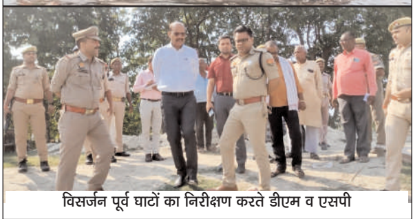
विसर्जन पूर्व घंटों का निरीक्षण करते डीएम व एसपी