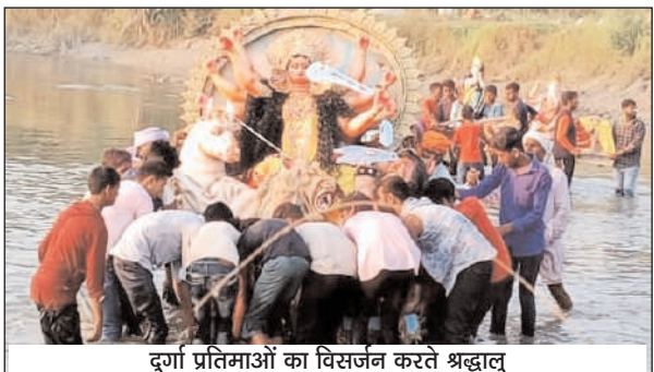
दुर्गा प्रतिमाओं का विसर्जन करते श्रद्धालु

संख्या में श्रद्धालु पूजा करने के लिए आते रहे। सोमवार और मंगलवार की रात में भी श्रद्धालुओं की भीड़ लगी रही। पुलिस के जवान और दुर्गा पूजा समितियों के सदस्य दुर्गा पूजा सकुशल संपन्न कराने में लगे रहे। दुर्गा पूजा समितियों की तरफ से भंडारा का आयोजन भी किया गया था। जिसमें दुर्गा पूजा का मेला करने आए श्रद्धालुओं ने प्रसाद ग्रहण किया। पड़रौना नगर के छवनी बेलवा चुंगी स्थित पूर्वांचल दुर्गा पूजा समिति, शिवालय चौराहे पर स्थित दुर्गा पूजा समिति, छवनी स्थित महादेव मंदिर परिसर में मां शेरवाली बाल दुर्गा पूजा समिति, नवयुवक दुर्गा पूजा समिति अखाड़ा नंबर नौ और अखाड़ा नंबर