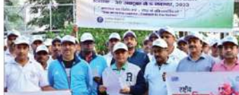
ایس ڈی ایم دفتر پنجاب کراچی کے ایک مطالبہ۔ ایس ڈی ایم دفتر پنجاب کراچی کے ایک مطالبہ۔ ایس ڈی ایم دفتر پنجاب کراچی کے ایک مطالبہ۔