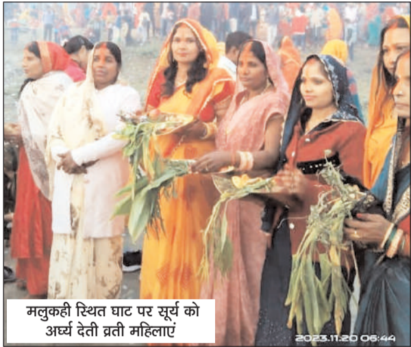
मलुकही स्थित छठ घाट पर सूर्य को अर्घ्य देती ब्रती महिलाएं