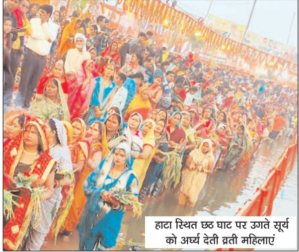
हाटा स्थित छठ घाट पर उगते सूर्य को अर्घ्य देती ब्रती महिलाएं

कुशीनगर (अवधानामा च्यूरो)। उल्लास, उमंग और भक्ति से सराबोर छठ की छटा शहर से लेकर गांवों तक फैली थी, लेकिन भक्ति गीतों के बीच क्रिकेट प्रेमियों की टीस भी रह रहकर उभर रही थी। वर्ल्ड कप के फाइनल में ऑस्ट्रेलिया से मिली हार की चर्चा महिलाओं के बीच थी। नगर पंचायत मथौली के छठ घाट पर बड़ी स्क्रिन पर मैच की लाइव स्ट्रीमिंग की भी व्यवस्था थी। अस्ताचल सूर्य को अर्घ्य देकर लौट रही कुछ क्रिकेट प्रेमी महिलाएं कम स्कोर के बाद भी छठी माई से जीत की प्रार्थना कर रही थी। अगली सुबह जब घाट पर ब्रती लौटते तो उनके चेहरों पर हार की मायूसी थी।