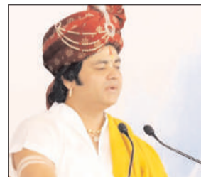
ठीक करने से पहले प्रत्येक जीव को अपनी आंतरिक सुंदरता बढ़ानी चाहिए। पार्वती के शरीरधरों में अपनी भक्ति को और ज्यादा से ज्यादा बढ़ाना चाहिए। पार्वती माता जन्म से ही भगवान शिव की भक्ति भक्त थी और उन्होंने शिवलिंग की पूजा बचपन से की। इसलिए उन्हें भगवान भोलेनाथ पति स्वरूप में मिले। बापू ने कहा कि भगवान शिव सदैव प्रभु राम के चिंतन में मग्न रहते हैं, लेकिन विधाता जिसके भाग्य में जो लिखते हैं वह अवश्य ही उसको प्राप्त हो जाता है। माता पार्वती की भक्ति से भगवान शिव प्रसन्न हुए भगवान शिव जब विवाह करने गए तो उन्होंने चिता की भस्म अपने शरीर में