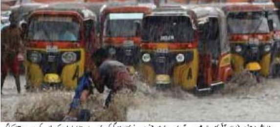
صومالیہ میں سیلاب سے متاثرہ علاقوں کی تصویر

صومالیہ میں سیلاب سے متاثرہ علاقوں کی تصویر صومالیہ میں سیلاب سے متاثرہ علاقوں کی تصویر صومالیہ میں سیلاب سے متاثرہ علاقوں کی تصویر