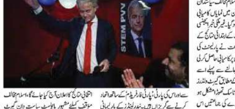
نیدرلینڈ کے پارلیمانی انتخابات میں اسلام مخالف سیاستدان کی نمایاں کامیابی

نیدرلینڈ کے پارلیمانی انتخابات میں اسلام مخالف سیاستدان کی نمایاں کامیابی نیدرلینڈ کے پارلیمانی انتخابات میں اسلام مخالف سیاستدان کی نمایاں کامیابی نیدرلینڈ کے پارلیمانی انتخابات میں اسلام مخالف سیاستدان کی نمایاں کامیابی