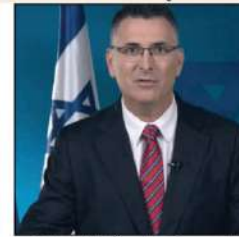
اسرائیلی وزیر اعظم بنیامین نتانیوہ

یروشلم کی رہائی کے امکان پر غور کیا جاسکے اور اس طرح اس جنگ کو ختم کر دیا جائے۔ جنگ سے پہلے جنگ روکنے کا کوئی ارادہ نہیں ہے۔ اسرائیلی وزیر اعظم بنیامین نتانیوہ نے کہا ہے کہ اسرائیل نے فلسطینیوں کو ہارنا نہیں چاہتا۔ اسرائیلی وزیر اعظم بنیامین نتانیوہ نے کہا ہے کہ اسرائیل نے فلسطینیوں کو ہارنا نہیں چاہتا۔