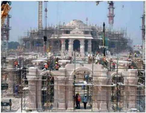
رام مندر کی حفاظت صدر اور پارلیمنٹ ہاؤس جیسی ہوگی۔

ایوزپور: رام مندر کی حفاظت صدر اور پارلیمنٹ ہاؤس کی طرح ہوگی۔ آئی ایس ایف نے سکورٹی پلان تیار کرنا شروع کیا ہے۔ پلان میں آج آج تک تمام ضروریات پر غور کیا گیا ہے۔ اس پلان میں آئی ایس ایف نے سکورٹی پلان تیار کرنا شروع کیا ہے۔ اس پلان میں آئی ایس ایف نے سکورٹی پلان تیار کرنا شروع کیا ہے۔