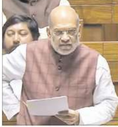
امت شاہ کے بیان پر فاروق عبداللہ کا جوابی حملہ

جموں و کشمیر رییزویشن ترمیمی بل اور جموں و کشمیر تنظیم نو ترمیمی بل پر لوک سبھا میں طویل بحث کے بعد منظور