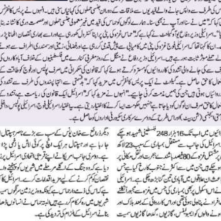
بیتن یاہو کی تصویر

غزہ (بیتن یاہو) ڈیڑھ ماہ سے محاصرے میں ہے اور اس کی ضمانت صرف اسرائیلی فوج دے سکتی ہے۔ اسرائیلی فوج نے خان یونس کے محاصرے کو ختم کرنے کے لیے غزہ کی طرف سے اسرائیلی فوج کو غیر مسلح کرنا ناگزیر ہے اور اس کی ضمانت صرف اسرائیلی فوج دے سکتی ہے۔