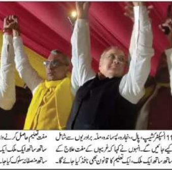
ایس پی کے رہنما دانشگر سنگھ نے ایک جلسے میں لوگوں کو متاثر کیا کہ اگر کوئی شخص پسماندہ طبقے سے ہے تو اسے اپنا حق مانگنا چاہیے۔

ایس پی کے رہنما دانشگر سنگھ نے ایک جلسے میں لوگوں کو متاثر کیا کہ اگر کوئی شخص پسماندہ طبقے سے ہے تو اسے اپنا حق مانگنا چاہیے۔ انھوں نے کہا کہ حکومت نے پسماندہ طبقے کے حقوق کو بے گناہ قرار دیا ہے اور ان کے حقوق کو بے گناہ قرار دینا، جو اس وقت تک نہیں ہو سکا۔ انھوں نے کہا کہ حکومت نے پسماندہ طبقے کے حقوق کو بے گناہ قرار دیا ہے اور ان کے حقوق کو بے گناہ قرار دینا، جو اس وقت تک نہیں ہو سکا۔