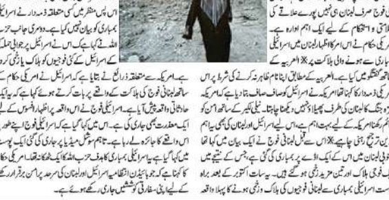
امریکی فوجیوں کی ہلاکت اور تین کے زخمی ہونے پر امریکہ کو تشویش

امریکی فوجیوں کی ہلاکت اور تین کے زخمی ہونے پر امریکہ کو تشویش۔ امریکی فوجیوں کی ہلاکت اور تین کے زخمی ہونے پر امریکہ کو تشویش۔