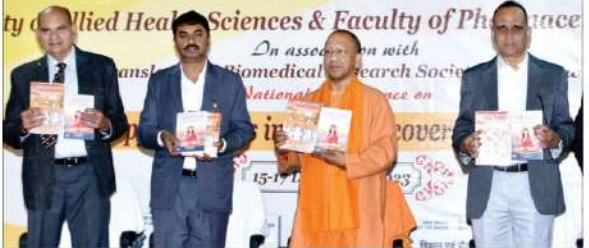
سی ایم یو کی نئی سیمینار سٹیجنگ کان 2023 کا افتتاح کیا گیا۔

عملی تقاضوں کو سمجھنے کے لیے صرف کتابی علم پر اٹھار کرنے کی بجائے تجربہ اور تحقیق پر توجہ مرکوز کرنی ہوگی، سی ایم یو کی نئی سیمینار سٹیجنگ کان 2023 کا افتتاح کیا