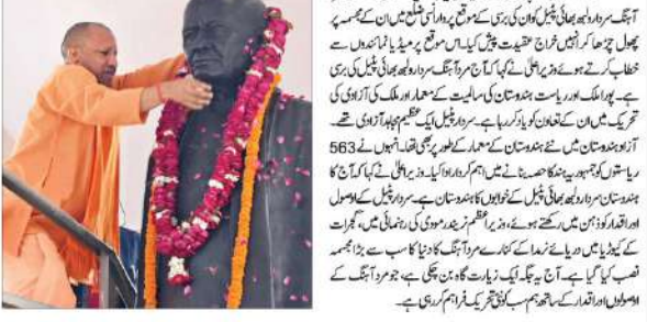
وزیر اعلیٰ نے سردار پٹیل کو خراج عقیدت پیش کیا۔

وزیر اعلیٰ نے سردار پٹیل کو خراج عقیدت پیش کیا ہے۔ انہوں نے سردار پٹیل کی خدمات اور ہندوستان کی تعمیر و ترقی میں ان کی کردار کو سراہا ہے۔