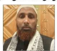
سہارنپور (جھڑا) میں شریک پریش کے دورے۔ سہارنپور (جھڑا) میں شریک پریش کے دورے۔

سہارنپور (جھڑا) میں شریک پریش کے دورے۔ سہارنپور (جھڑا) میں شریک پریش کے دورے۔ سہارنپور (جھڑا) میں شریک پریش کے دورے۔