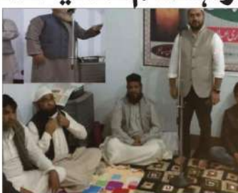
بزم ارباب سخن کے زیراہتمام نعتیہ نشست کا انعقاد ہوا۔ اس موقع پر نعتیہ کلام اور نعتیہ کلام پر روشنی ڈالی گئی۔

بزم ارباب سخن کے زیراہتمام نعتیہ نشست کا انعقاد ہوا۔ اس موقع پر نعتیہ کلام اور نعتیہ کلام پر روشنی ڈالی گئی۔ بزم ارباب سخن کے زیراہتمام نعتیہ نشست کا انعقاد ہوا۔ اس موقع پر نعتیہ کلام اور نعتیہ کلام پر روشنی ڈالی گئی۔