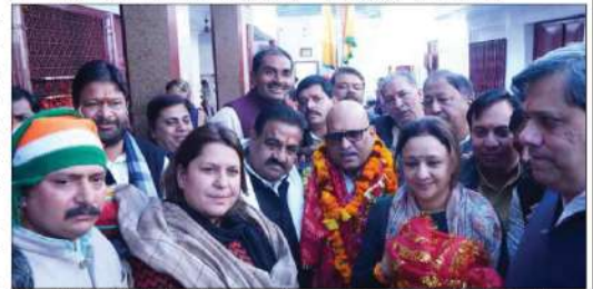
سہارنپور: کانگریس پارٹی نے پورے روز سہارنپور میں یوپی جوڑو یاترا کا آغاز کر دیا۔ کانگریس کے سابق صدر اے۔ پی۔ جے۔ کے ساتھ دیگر رہنماؤں نے شرکت کی۔

کسانوں، مزدوروں، تاجروں، نوجوانوں اور خواتین کے مسائل پر زور