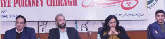
ایک اجلاس میں شرکت کرنے والے افراد

نئی دہلی، 20 دسمبر (پریس ریلیز)۔ مسلمانوں اور ایس سی، ایس ٹی کو ان کی آبادی کے تناسب سے حصہ داری دی جائے۔ انہوں نے کہا کہ حکومت کو اپنی پالیسیوں کو نافذ کرنے کے لیے اس اقدام کو اختیار لینا چاہیے۔