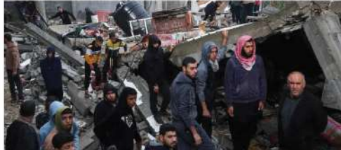
غزہ میں 11 شہریوں کو دیکھتے ہیں اہل خانہ کے سامنے گولیاں مارنے کی اطلاعات پر یو این پریشان

شمالی اور وسطی غزہ پر بمباری □ غزہ: ہسبرگ میں داخل ہونے والے صیہونی فوجیوں پر حملہ، 15 اسرائیلی فوجی ہلاک