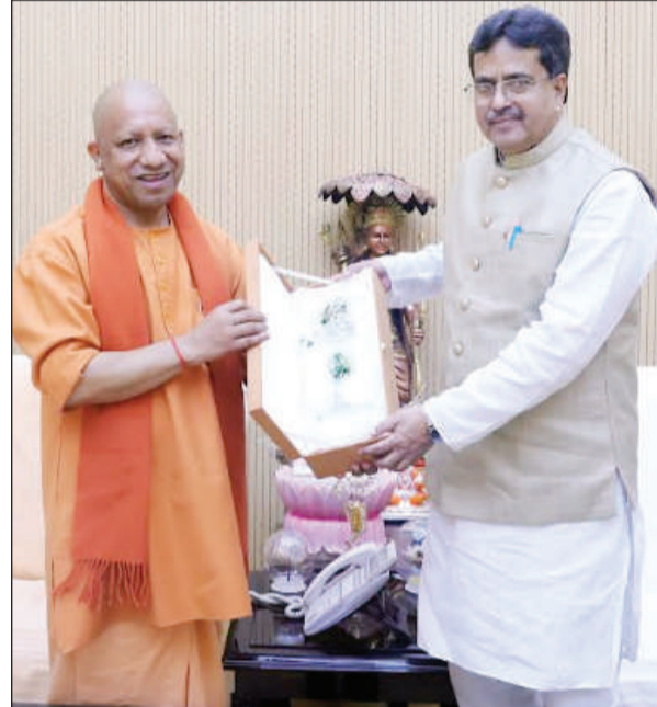
मुख्यमंत्री योगी आदित्यनाथ से उनके सरकारी आवास पर त्रिपुरा के मुख्यमंत्री डॉ0 माणिक साहा ने शिष्टाचार भेंट की।

पैक हाउसिंग बनाए जाएं तथा कृषि विज्ञान केन्द्रों में जैविक उत्पादों की टेस्टिंग लैब स्थापित की जा सकती है। उन्होंने इस सम्बन्ध में कृषि विभाग को उद्यान विभाग, पशुपालन विभाग व मत्स्य विभाग के साथ समन्वय स्थापित करते हुए विस्तृत कार्ययोजना बनाने के निर्देश दिए। मुख्यमंत्री ने निराश्रित पशुओं, जंगली जानवरों से कृषि फसलों की सुरक्षा सुनिश्चित करने के लिए किसानों को सोलर फेंसिंग के लिए प्रोत्साहित करने की आवश्यकता जतायी। उन्होंने कहा कि वन रोज, अथवा निराश्रित पशुओं के कारण प्रायः किसानों की फसलों की क्षति की सूचना मिलती है। इसके स्थायी समाधान के लिए हमें किसानों को सोलर फेंसिंग के लिए प्रोत्साहित करना होगा।