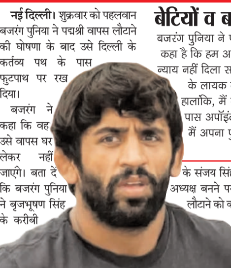
नई दिल्ली। शुक्रवार को पहलवान बजरंग पुनिया ने पद्मश्री वापस लौटाने की घोषणा के बाद उसे दिल्ली के कर्तव्य पथ के पास फुटपाथ पर रख दिया।

बजरंग ने कहा कि वह उसे वापस घर लेकर नहीं जायेंगे। बता दें कि बजरंग पुनिया ने बृजभूषण सिंह के करीबी के संजय सिंह के कुश्ती संघ अध्यक्ष बनने पर अपना पद्मश्री लौटाने को कहा था।