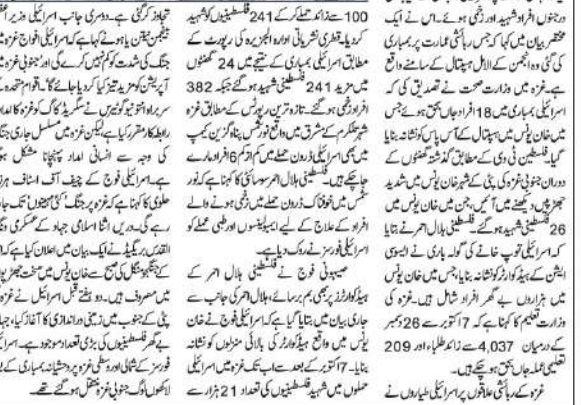
خان یونس ہسپتال پر فوجیوں کے حملے کے بعد برباد ہونے والا ہسپتال

غاصب فوجیوں کا خان یونس ہسپتال پر خوفناک حملہ کیا گیا۔ فوجیوں نے ہسپتال کو آگ لگا دی اور لوگوں کو قتل کیا۔ فوجیوں نے ہسپتال کو آگ لگا دی اور لوگوں کو قتل کیا۔ فوجیوں نے ہسپتال کو آگ لگا دی اور لوگوں کو قتل کیا۔