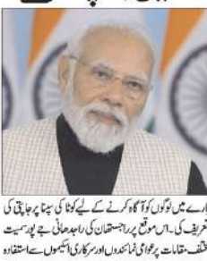
پی ایم مودی

پی ایم مودی نے سرکاری اکیٹمیوں کے بارے میں لوگوں کو آگاہ کرنے کے لیے پتائی کی تحریکیں نئی دہلی، 27 دسمبر (ای این آئی) وزیر اعظم مودی نے سرکاری اکیٹمیوں کے بارے میں لوگوں کو آگاہ کرنے کے لیے پتائی کی تحریکیں شروع کی ہیں۔ ان کی طرف سے جاری کیے گئے پتائی کی تحریکیں لوگوں کو آگاہ کرنے کے لیے پتائی کی تحریکیں شروع کی ہیں۔ ان کی طرف سے جاری کیے گئے پتائی کی تحریکیں لوگوں کو آگاہ کرنے کے لیے پتائی کی تحریکیں شروع کی ہیں۔