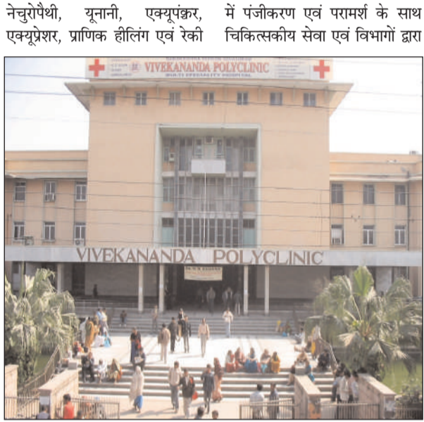
द्वारा इलाज किया जा रहा है। इस अवसर पर आयुष विभाग द्वारा एक दिवसीय निःशुल्क शिविर

लखनऊ। रामकृष्ण मिशन की स्थापना के 125वीं वर्षगांठ के उपलक्ष्य में विवेकानन्द पॉलीक्लीनिक एवं आयुर्विज्ञान संस्थान, लखनऊ के आयुष विभाग में एक दिवसीय निःशुल्क आयुष (आयुर्वेद पंचकर्म, योग एवं प्राकृतिक चिकित्सा, होम्योपैथी, यूनानी, एक्ज्यूपंकर, एक्ज्यूप्रेशर, रेकी, प्राणिक हीलिंग) परामर्श एवं जागरूकता शिविर का आयोजन प्रत्येक माह के अन्तिम शनिवार को आयोजित किया जा रहा है।