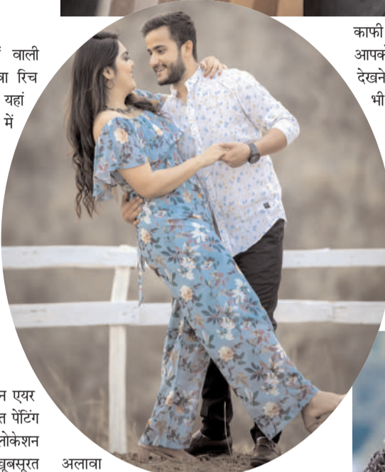
अलावा भरतपुर में आप लोहागढ़ किले में भी शूट करवा सकते हैं।

काफी कम एक्सप्लोर किया गया है। ऐसे में यहां पर आपको प्राकृतिक सुंदरता और अनोखी हरियाली देखने को मिलेगी। वहीं प्री-वेडिंग शूट के लिए यह भी एक अच्छा ऑप्शन है।