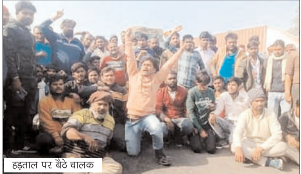
हड़ताल पर बैठे चालक

व्हीकल एक्ट के विरोध में परिवहन निगम के चालक मंगलवार को भी हड़ताल पर रहे। इससे यात्रियों की परेशानी बढ़ गई है। उन्हें गंतव्य तक जाने के लिए पड़ोना सहित अन्य बस स्टेशनों पर घंटों वाहनों का इंतजार करना पड़ा। ट्रक चालक भी आंदोलनरत रहे। राष्ट्रीय राजमार्ग-28 पर कसया जैन धर्म कांटा के पास ट्रक चालकों ने चक्का जाम कर विरोध