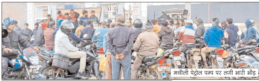
मथौली पेट्रोल पम्प पर लगी भारी भीड़

जगह बंद रहे। बस चालकों ने नए कानून को वापस लेने की केंद्र सरकार से मांग की। इसका असर आंटी चालकों पर भी पड़ा और कई जगह आंटी नहीं चले। इससे यात्रियों को काफी दिक्कतों का सामना करना पड़ा। बता दें कि नए कानून के तहत सरकार हिट एंड रन मामले में दुर्घटना होने पर चालकों के खिलाफ दस साल की सजा और सात लाख रुपए जुर्माना लगाने की घोषणा की है। वीते कई दिनों से सोशल साइट पर नए कानून के खिलाफ एकजुटता के बावत संदेश भी चलाए जा रहे हैं। नए मोटर