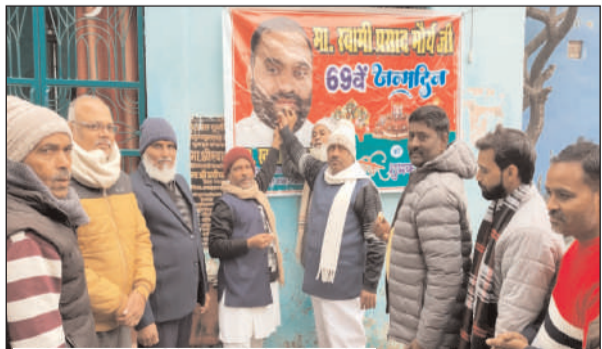
स्वामी प्रसाद मोर्य के चित्र को केक खिलाते