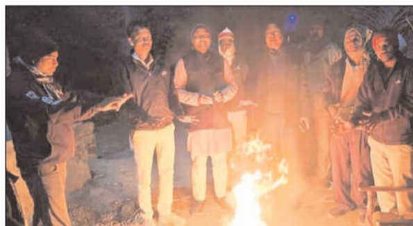
ठंड से बचने हेतु अलाव जलाते लोग

इस दौरान सुबह शाम आसमान में बादल छाए रहने के साथ कोहरा रहने की संभावना है। बता दें कि जिले में ठंड का प्रकोप तेजी से बढ़ता जा रहा है। पिछले दस दिनों से गलन भरी ठंड से लोग परेशान हैं। रविवार को दोपहर बाद करीब एक बजे आसमान साफ हुआ तो हल्की धूप निकली। इसके बाद लोगों को ठंड से कुछ गहत मिली। लेकिन दिन ढलते ही पुनः लोग गलन भरी ठंड से परेशान हो गए। बाइक चलाने वाले चालक बिना