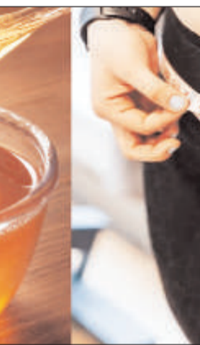
अस्थिमा, कफ और यूरिनरी ट्रैक्ट डिस्ऑर्डर को दूर करने में शहद मददगार है।

साथ ही यह कफ को भी दूर करने में सहायक होता है। कोल्ड की समस्या में भी यह फायदेमंद होता है।