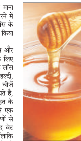
किस प्रकार शहद का सेवन करना चाहिए।

आयुर्वेद में शहद को वेत फैट बर्नर माना जाता है। लेकिन वजन घटाने के लिए शहद का कैसे सेवन करना चाहिए और शहद का सेवन करने के दौरान किन-किन गलतियों को करने से बचना चाहिए। इसके बारे में भी जानना बेहद जरूरी है। आज इस आर्टिकल के जरिए हम आपको बताते जा रहे हैं कि