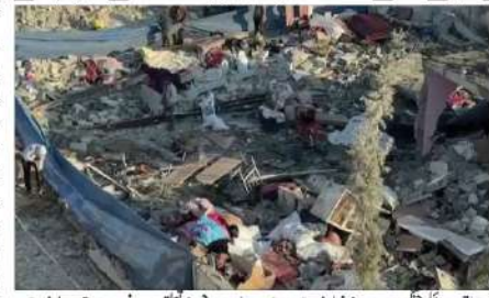
غزہ (جسٹس) غزہ کی پٹی میں اسرائیلی جنگ جاری ہے۔ دوسری جانب اسرائیل دفاعی بلاغ نے کام کے حوالے سے بتایا ہے کہ غزہ میں جاری اسرائیلی جنگ میں اس سال کے عرصے میں سے تین فی صد جنگجو ہلاک ہو چکے ہیں۔ اسرائیلی اخباروں اور خبریں کے مطابق اسرائیلی فوجیں غزہ میں کام کا خیال ہے۔ غزہ میں جاری جنگ میں اس سال سے 20 سے 30 فی صد جنگجو ہلاک ہو چکے ہیں۔ اسرائیلی فوج کا خیال ہے کہ غزہ میں پانچ لاکھ سے زائد فلسطینی رہتے ہیں۔ اسرائیل کے موجودہ اور سابق سربراہوں نے کہا ہے کہ اسرائیل کے ساتھ ساتھ فلسطینی فوج بھی اسرائیل کے ساتھ ساتھ کام کر رہی ہے۔ اسرائیلی فوج کا خیال ہے کہ غزہ میں پانچ لاکھ سے زائد فلسطینی رہتے ہیں۔ اسرائیل کے موجودہ اور سابق سربراہوں نے کہا ہے کہ اسرائیل کے ساتھ ساتھ فلسطینی فوج بھی اسرائیل کے ساتھ ساتھ کام کر رہی ہے۔

اسرائیل، امریکہ سے کیے گئے فلسطینی ریاست کے قیام کے وعدے سے مکر گیا