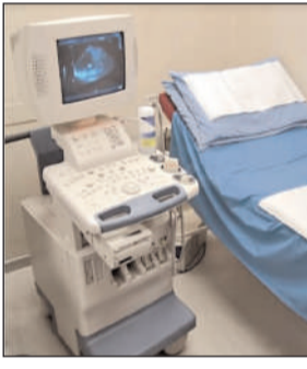
होती है। कुल मिलाकर स्पष्ट रूप से यह कहा जा सकता है की उत्तर प्रदेश में इस वक्त अधिकारियों द्वारा जंगल राज स्थापित कर दिया गया है खुलेआम मनमानी जनता द्वारा शिकायत करने पर कोई कार्रवाई नहीं जनता त्रस्त अधिकारी मस्त की स्थिति इस वक्त हो गई है घटनाओं के बाद घटनाएँ जनता के साथ आए दिन कभी यह हो रहा है कि इस अस्पताल में मरीज का ऑपरेशन के दौरान मौत हो गया और अस्पताल के सौर कर्मचारी और डॉक्टर फरार आखिर यह बिना अधिकारियों के संरक्षण के संभव नहीं है अधिकारी को सारी जानकारी होने के बाद भी जिले के उच्च अधिकारी एवं तहसील क्षेत्र के उच्च अधिकारी कितने भी शिकायत करने के बाद कार्यवाही नहीं करते कार्यवाही क्यों नहीं करते इसका भी एक कारण है क्योंकि जो भ्रष्टाचार इस वक्त खुलेआम किया जा रहा है उन लोगों का कहना है की कोई भी कार्य हम लोग ऐसे ही नहीं करते इसकी कीमत उच्च अधिकारियों तक दी जाती है तभी तो हम लोग खुलेआम करते हैं।

भाटपार रानी, देवरिया। एक तरफ जहां सूबे के मुखिया योगी आदित्यनाथ प्रदेश में स्वास्थ्य सुविधाओं को बेहतर बनाने के लिए लगातार नई योजनाएँ ला रहे हैं और सरकारी अस्पतालों को हर सुविधा से लैस कर रहे हैं वहीं उनके ही मातहत उनको महत्वाकांक्षी योजनाओं को घरातल पर ठेंगा दिखा रहे हैं सूबे के स्वास्थ्य मंत्री व उप मुख्यमंत्री ब्रजेश पाठक के द्वारा अवैध अस्पतालों के खिलाफ जागृता चलाये जा रहे अभियान को जमीनी स्तर पर हकीकत सून्य है स्थानीय नगर पंचायत व ग्रामीण क्षेत्र में अवैध अस्पताल, अल्ट्रा साउंड केंद्र व जांच केंद्र धड़ल्ले से संचालित हो रहे हैं लेकिन इस पर कोई जिम्मेदार ध्यान नहीं देते हैं जिस की वजह से आये दिन मरीजों को परेशानी का सामना करना पड़ रहा है।