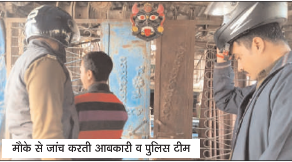
मौके से जांच करती आबकारी व पुलिस टीम