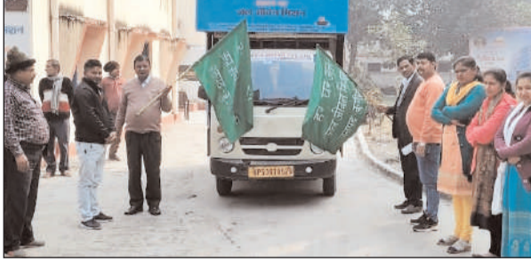
जागरूकता वाहन को हरी झंडी दिखाते बीडीओ रामकोला