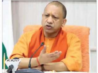
یوگی نے کہا کہ ریاست میں پہلے بھی پوینیشنل تھا لیکن تب کی حکومتوں نے اس کا بہتر استعمال نہیں کیا۔

ریاست میں پہلے بھی پوینیشنل تھا لیکن تب کی حکومتوں نے اس کا بہتر استعمال نہیں کیا