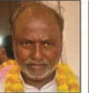
परमात्मा पशुपति नगर