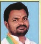
सत्यनारायण पटेल नगर