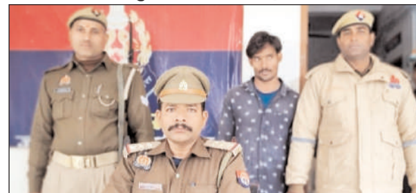
पुलिस के हस्ते तड़ा पावरो एक्ट का आरोपी