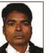
साकीर निराला नगर