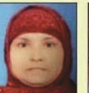
मोमिना शास्त्री नगर