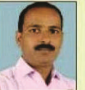
श्याम बाबू पन्त नगर