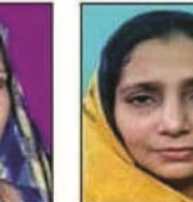
शमा आरा अकबर नगर

एवं समस्त नगर पालिका परिषद बांसी के कर्मचारीगण