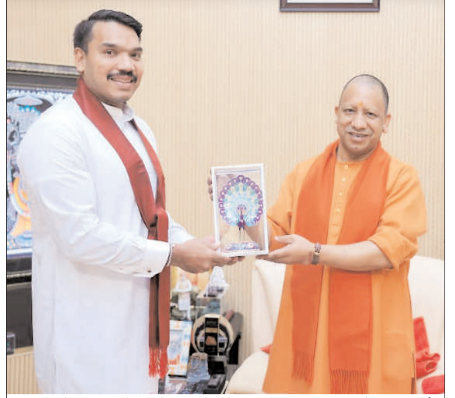
उत्तर प्रदेश के मुख्यमंत्री योगी आदित्यनाथ से उनके सरकारी आवास पर श्रीलंका के सांसद व पूर्व मंत्री नमल राजपक्ष ने शिष्टाचार भेंट की।

इसलिए प्रदेश बीमारू राज्यों की सूची में आता था पर हमने यूपी को अब देश की दूसरी सबसे बड़ी अर्थव्यवस्था बना दिया है।