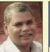
बुद्धिसाम प्रजापति निषाद नगर