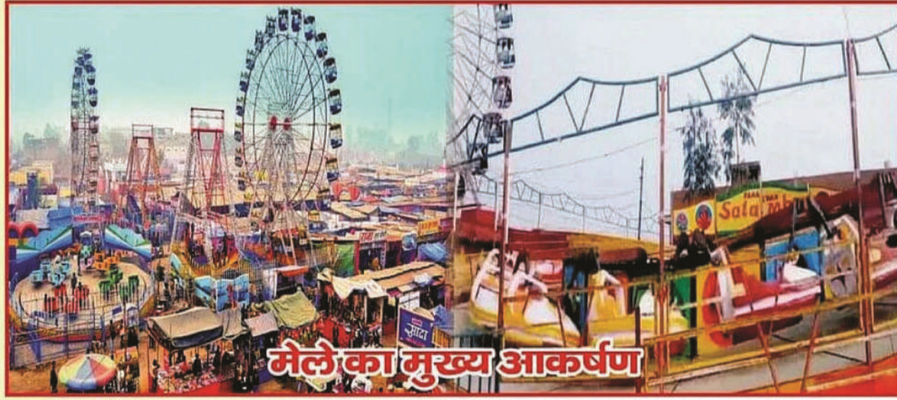
मेले का मुख्य आकर्षण

सर्कस, थियेटर, ड्रामा, डान्स पार्टी, काला जादू, झूला, ब्रेक डान्स, भूत बंगला, मारुती कार वाला कुआं, हवाई झूला तथा प्रसिद्ध स्टाल एवं शासकीय विभागों की प्रदर्शनी, लोक जीवन पर आधारित सांस्कृतिक कार्यक्रम आदि।