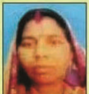
मैना देवी नेहरू नगर