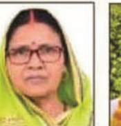
अनुसुधा गांधी नगर