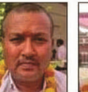
चन्द्र कुमार राजेन्द्र नगर