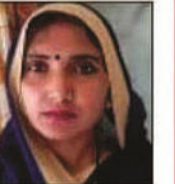
सरिता आजाद नगर