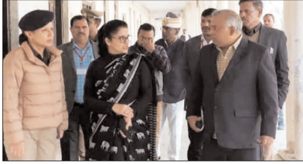
डीएम एसापी ने किया परीक्षा केंद्रों का भ्रमण केंद्र व्यवस्थापन को दिए परीक्षा नियमों का पालन करने के निर्देश

बहराइच। उत्तर प्रदेश पुलिस भर्ती एवं प्रोन्नति बोर्ड द्वारा आरक्षी नागरिक पुलिस सीधी भर्ती परीक्षा 2023 के दुष्प्रियत जिलाधिकारी मोनिका रानी व पुलिस अधीक्षक वृन्दा शुक्ला ने जिले में चल रही परीक्षा के केंद्रों का निरीक्षण कर सुरक्षा व्यवस्था का जायजा लिया। उन्होंने ड्यूटी पर लगे समस्त अधिकारी/कर्मचारीगण को दिये गये आवश्यक दिशा निर्देश। इस दौरान सुरक्षा के कड़े बंदोबस्त रहे। इस परीक्षा के लिए जिले में कुल 14 परीक्षा केंद्र निर्धारित किये गये हैं। जिलाधिकारी व पुलिस अधीक्षक द्वारा महिला पीजी कालेज, वैद्य भगवानदीन मिश्र गांधी इंटर कालेज, राजकीय इंटर कालेज, राजकीय बालिका इंटर कालेज, किसान पीजी कालेज, महात्मा बुद्ध विद्यापीठ का