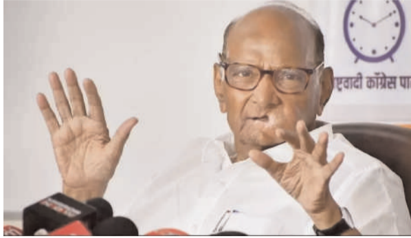
सुप्रीम कोर्ट का रुख किया है।

गुट के पक्ष में ही फैसला सुनाया था। शरद पवार ने इसके खिलाफ