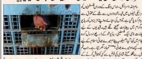
اسرائیلی جیلوں میں قید فلسطینیوں کے عزیزوں کو بذریعہ ریڈیو پیغامات

رفح پر حملہ کرنے کی صورت میں اسرائیل کو ہتھیاروں کی فروخت پر پابندی پر غور