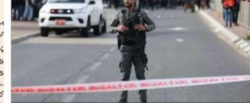
مغربی کنارہ (یوٹھ) میں اسرائیلی فوجیوں کی طرف سے اسرائیلی بستی کے قریب فائرنگ

رام ہائٹس اسرائیلی جاس جنگ سے دوران فلسطینیوں کو اسرائیلی جیلوں میں قید شدہ افراد سے ملنے کے حلقے سے عزم کر رہا ہے۔ یہاں کے جاس نے کہا ہے کہ وہ اپنے عزیزوں کو بچانے کے لیے فائرنگ کرے گا۔ اسرائیلی فوجیوں نے پچھلے دنوں کے دوران اسرائیلی بستیوں میں فائرنگ کی ہے۔ اسرائیلی فوجیوں نے پچھلے دنوں کے دوران اسرائیلی بستیوں میں فائرنگ کی ہے۔ اسرائیلی فوجیوں نے پچھلے دنوں کے دوران اسرائیلی بستیوں میں فائرنگ کی ہے۔