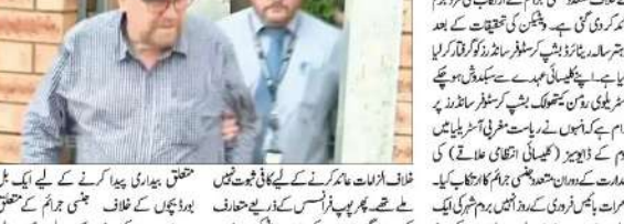
سابق آسٹریلیا میں بے شپ پر فرد جرم عائد

سابق آسٹریلیا میں بے شپ پر فرد جرم عائد۔ ایک شخص نے اپنے بچوں کے خلاف جنسی جرائم کیس میں جرم ثابت کیا۔ عدالت نے اسے سزا سنائی۔