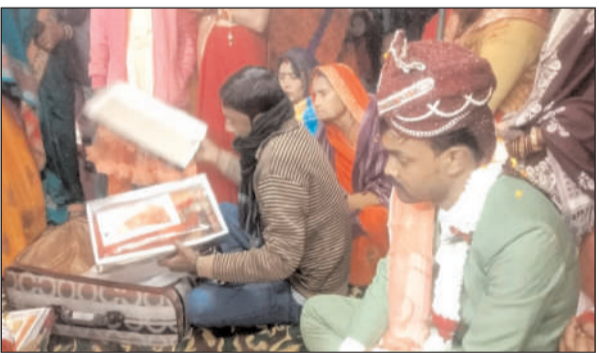
अहिरौली थाना क्षेत्र का मामला, मशौली करवे का निवासी है युवक

अहिरौली, कुशीनगर। जिले के एक गांव में लव जिहाद का हैरान कर देने वाला मामला सामने आया है, जहां एक साल तक शारीरिक संबंध के बाद मामला शादी तक पहुंच गया। जब दरवाजे पर बारात पहुंची तो युवक द्वारा बोले गए सभी झूठ का पर्दाफाश हो गया, जिसे जानकर सभी लोग दंग रह गए।