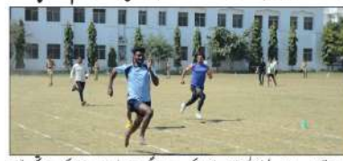
شیعہ کالج میں شیاڈ اسپورٹس فیسٹ 2024 کا آغاز۔

فرمان نے دوسرا اور اہمیت رکھنے والا خطاب کیا۔