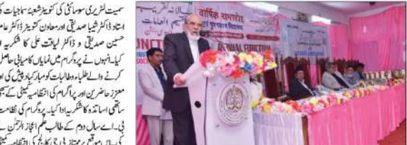
ممتازی جی کالج میں سالانہ تقریب و تقسیم انعامات کا انعقاد۔