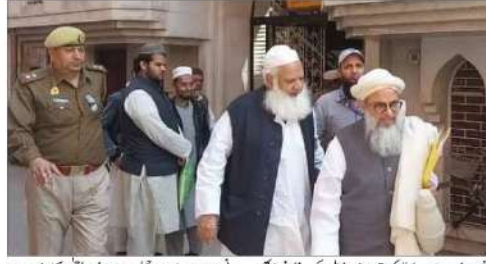
مجلس شوری کے اجلاس میں طلبہ کے لیے سخت قوانین بنائے گئے۔

سپریمہ اسلامک ایجوکیشنل ایسوسی ایشن اور اسلامک ایجوکیشنل ایسوسی ایشن (ایکٹیوٹیٹس) کے اجلاس میں طلبہ کے لیے سخت قوانین بنائے گئے۔