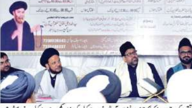
حضرت غفران ماب کی تقریر کی تصویر

حضرت غفران ماب نے مکتب امامیہ کی ترویج میں کوئی دقیقہ فروگذاشت نہیں کیا۔ اس کے تحت ہندوستان کی تیسری اقتصادی طاقت بنانے کا ہندوستان کے وزیر پلاننگ کا ایک نیا سہارا بن گیا ہے۔ حضرت غفران ماب نے مکتب امامیہ کی ترویج میں کوئی دقیقہ فروگذاشت نہیں کیا۔ اس کے تحت ہندوستان کی تیسری اقتصادی طاقت بنانے کا ہندوستان کے وزیر پلاننگ کا ایک نیا سہارا بن گیا ہے۔