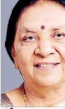
گورنر اتھنڈی بین ٹیٹل کی تصویر

گورنر اتھنڈی بین ٹیٹل نے دین دیال ویٹری یونیورسٹی کے طلباء کو کیا خطاب۔ اس کے تحت ہندوستان کی تیسری اقتصادی طاقت بنانے کا ہندوستان کے وزیر پلاننگ کا ایک نیا سہارا بن گیا ہے۔ گورنر اتھنڈی بین ٹیٹل نے دین دیال ویٹری یونیورسٹی کے طلباء کو کیا خطاب۔ اس کے تحت ہندوستان کی تیسری اقتصادی طاقت بنانے کا ہندوستان کے وزیر پلاننگ کا ایک نیا سہارا بن گیا ہے۔