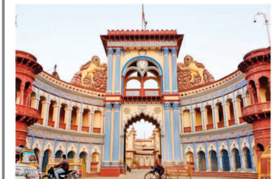
अयोध्या स्थित राजसदन

अयोध्या सनातन धर्म का केंद्र बिंदु बनने जा रहा है। यहां पर्यटन संस्कृति एवं धार्मिक रूप से सुनियोजित विकास का कार्य तेज गति से चल रहा है। सरकार देशभर के मंदिरों की गौरवगाथा को प्रदर्शित करने वाला विशाल संग्रहालय बनाने जा रही है। यूपी पर्यटन विभाग इसे लेकर विस्तृत कार्ययोजना तैयार करने में जुट गया है। इस मंदिर संग्रहालय का निर्माण प्रभु श्रीराम की नगरी अयोध्या में किया जाना है। अपने स्थापत्य की भव्यता से परे, भारतीय मंदिर संस्कृति की अभिव्यक्तियों भी हैं। भारतीय संस्कृति की आत्मा का प्रत्येक घटक मंदिरों में मिलता है। भारतीय मंदिरों की इन बहुआयामी सोच को अब योगी सरकार मंदिर संग्रहालय के जरिये दुनिया के सामने लाने जा रही है।