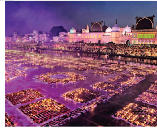
दीपोत्सव का मनमोहक दृश्य

अयोध्या को चित्रकूट से जोड़ने वाला राम वन गमन पथ अब छह लेन का बनेगा। इससे यूपी के कई जिलों के लोगों को भी सुविधा होगी। रामायण सर्किट के नजरिये से भी यह बेहतर होगा। इस मार्ग को छह लेन में बदलने से रामनगरी से तीर्थराज प्रयाग व चित्रकूट तक श्रद्धालुओं का आवागमन बेहद सुगम हो जाएगा। आसपास के तमाम जिलों से कार्य व्यवसाय आसान होगा। मध्य प्रदेश समेत अन्य राज्यों से बेहतर जुड़ाव सड़क मार्ग के जरिये हो सकेगा।