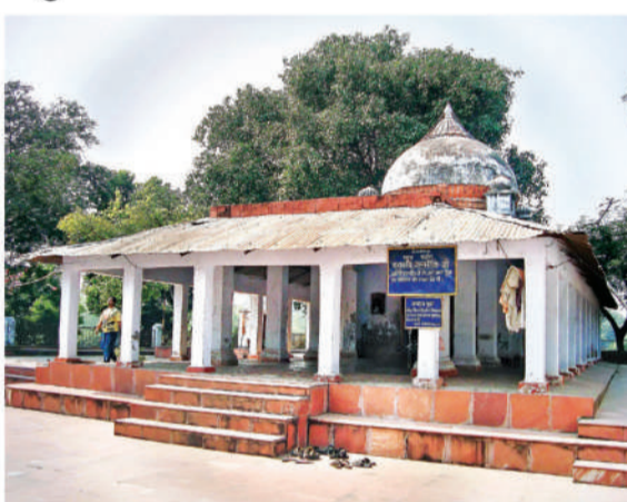
सरकार ने 1.52 करोड़ रुपये का प्रावधान किया है।

बिठूर उत्तर प्रदेश में कानपुर के निकट स्थित एक छोटा सा धार्मिक शहर है। प्रभु श्रीराम द्वारा त्यागे जाने के पश्चात माता सीता को लक्ष्मण ने यहीं छोड़ा था। गंगा नदी के समीप ही वाल्मीकि का आश्रम है, जहां पर माता सीता ने लव एवं कुश को जन्म दिया था तथा उनका पालन-पोषण किया था। इसी स्थान पर लव एवं कुश ने श्रीराम के अश्वमेधयज्ञ के अश्व को रोका था तथा हनुमान को बंदी बनाया था। यहां आज भी वह स्थान स्थित है जहां महर्षि वाल्मीकि ने रामायण लिखी थी। योगी सरकार बिठूर में भगवान राम के पुत्रों के जन्मस्थान ऋषि वाल्मीकि आश्रम को भी संवार रही है। आश्रम के जीर्णोद्धार के लिए