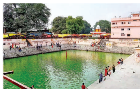
सरकार द्वारा 10 एकड़ जमीन पर मेला परिसर, दर्शकों व श्रद्धालुओं के लिए मूलभूत सुविधाओं का विकास किया जा रहा है।

बिजेथुआ महावीरन धाम लाखों श्रद्धालुओं की आस्था का केंद्र है। यह पौराणिक स्थल सुलतानपुर जनपद के कादीपुर तहसील क्षेत्र में है। कहते हैं कि यह वह स्थान है, जहां त्रेता युग में हनुमान जी ने कालनेमि नाम के राक्षस का वध किया था। संकट से मुक्ति के लिए हर मंगलवार व शनिवार को यहां श्रद्धालुओं की भीड़ उमड़ती है। लंबे समय से इस क्षेत्र विकास के लिए प्रतिबद्ध उत्तर प्रदेश सरकार द्वारा इसे रामायण सर्किट में शामिल कर लिया गया है। रामायण सर्किट में शामिल इस धाम के पर्यटन विकास के लिए प्रदेश