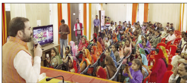
किसान मोर्चा का गांव परिक्रमा कार्यक्रम

सभी ब्लॉक सहित 25 मंडलों में सुना गया पीएम का लाइव प्रसारण