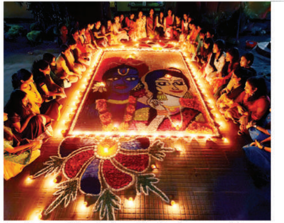
दीपावली पर्व पर फूलों से बनाई गयी राम-सीता की तस्वीर - (फाइल फोटो)

उत्तर प्रदेश में काशी जिस तरह तीर्थ यात्रियों के साथ-साथ पर्यटकों के लिए भी पसंदीदा स्थल है, ठीक उसी तरह योगी सरकार अब भगवान राम की नगरी अयोध्या को आस्था के साथ-साथ पर्यटन नगरी भी बना रही है। अयोध्या में वाटर क्रूज, वाटर टैक्सो, हाट एयर बैलून, वाटर स्पोर्ट्स जैसे आयोजन शुरू रहे हैं।