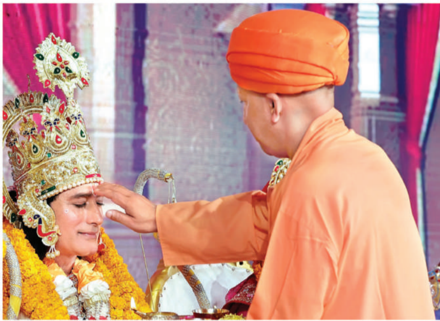
अयोध्या दीपोत्सव के दौरान श्रीराम के रूप में सजे कलाकार का तिलक करते मुख्यमंत्री योगी आदित्यनाथ

उत्तर प्रदेश में नई पर्यटन नीति के तहत प्रदेश में धार्मिक और प्राकृतिक स्थलों की बहुतायत संख्या को देखते हुए अलग-अलग सर्किट का विकास किया जा रहा है। इनमें से एक है रामायण सर्किट। रामायण सर्किट में अयोध्या, बिठूर (कानपुर), बिजेथुआ महावीरन (सुलतानपुर), चित्रकूट और शृंगवेरपुर (प्रयागराज) शामिल हैं।