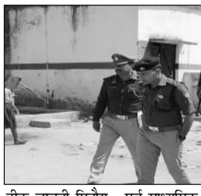
टीक छवनी मिश्रा, पूर्व माध्यमिक विद्यालय सेखुई मिश्रा व प्राथमिक विद्यालय पड़री कला मिश्रा थाना

महाराजगंज। पुलिस अधीक्षक ने चौक थाना क्षेत्र में आगामी लोकसभा चुनाव के दृष्टिगत संवेदनशील बूथों का निरीक्षण किया। चौक थाने का औचक निरीक्षण करते हुए कार्यालय के अभिलेखों महिला हेल्प डेस्क रजिस्टर, आंगतुक रजिस्टर, अपराध रजिस्टर, विवेचना रजिस्टर ग्राम रजि0, लौहार रजि0, आदि रजिस्ट्रों का अवलोकन किया गया। कार्यालय में नियुक्त पुलिस कर्मी को रजिस्टर अद्यतन करने के साथ-साथ उनके रख रखाव के सम्बन्ध में निर्दिष्ट किया गया साथ ही कार्यालय में रखे अन्य महत्वपूर्ण फाइलों एवं रजिस्ट्रों के रख रखाव की स्थिति का जायजा लिया गया। सीसीटीवीएस कार्यालय को चेक करते हुए साफ-सफाई रखने तथा राजकीय कार्यों को समय से पूरा करने हेतु निर्देशित किया गया। तत्पश्चात महोदय द्वारा आगामी लोकसभा चुनाव 2024 के दृष्टिगत थाना चौक क्षेत्रान्तर्गत पड़ने वाले संवेदनशील बूथ जमुना प्रसाद शंभू प्रसाद इंटर कॉलेज