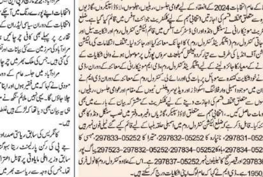
ڈی ایم سے مر بوط کنٹرول روم کا معائنہ کیا گیا۔

ڈی ایم سے مر بوط کنٹرول روم کا معائنہ کیا گیا۔ ڈی ایم سے مر بوط کنٹرول روم کا معائنہ کیا گیا۔ ڈی ایم سے مر بوط کنٹرول روم کا معائنہ کیا گیا۔