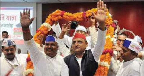
پلوپتی پٹیلا کے بعد ایک اور ساتھی نے کھڑا کیا امیدوار۔

لکھنؤ۔ جنرل ودھو پائی، جیوانی ودھو پائی کے ساتھ ساتھ اخبار میں ہے۔ بھارت اتحاد کے امیدواروں کے لیے ہیں۔ ان کے اسٹیٹس میں بدلتی ہوئی صورتحال کے ساتھ ساتھ انہیں لگاتار دیکھنا پڑے گا۔ ان کے لیے بھی ملنے والی امکانات کو مدنظر رکھنا پڑے گا۔ ان کے لیے بھی ملنے والی امکانات کو مدنظر رکھنا پڑے گا۔ ان کے لیے بھی ملنے والی امکانات کو مدنظر رکھنا پڑے گا۔