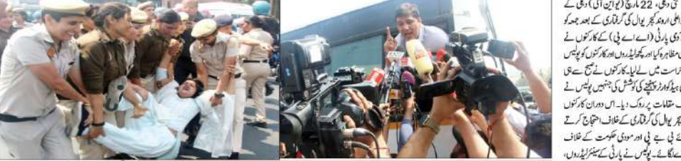
ٹی وی، 22 مارچ (ای این آئی) دہلی کے ذریعہ ایمر یوال کی گرفتاری کے بعد جوہر کو آئی کی گرفتاری کے خلاف نعرے لگائے گئے۔ ملک میں غیر اعلیٰ ایمر جنسی جسی صورت حال: اسے پی، بی نے پی اور مووی حکومت کے خلاف نعرے لگائے گئے۔ کئی ایڈوان اور کارکنان کو پولیس نے حراست میں لیا۔

ملک میں غیر اعلیٰ ایمر جنسی جسی صورت حال: اسے پی، بی نے پی اور مووی حکومت کے خلاف نعرے لگائے، کئی ایڈوان اور کارکنان کو پولیس نے حراست میں لیا