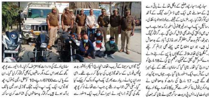
پولیس فورس کے ساتھ گاڑیوں کی جانچ کر رہے تھے۔ اس دوران پولیس نے آٹھ ڈاک زنیوں کو گرفتار کیا۔

میرٹھ اور غازی آباد میں ڈاک زنی کی واردات، آٹھ ہوئے گرفتار۔ پولیس فورس کے ساتھ گاڑیوں کی جانچ کر رہے تھے۔ اس دوران پولیس نے آٹھ ڈاک زنیوں کو گرفتار کیا۔ میرٹھ اور غازی آباد میں ڈاک زنی کی واردات، آٹھ ہوئے گرفتار۔ پولیس فورس کے ساتھ گاڑیوں کی جانچ کر رہے تھے۔ اس دوران پولیس نے آٹھ ڈاک زنیوں کو گرفتار کیا۔ میرٹھ اور غازی آباد میں ڈاک زنی کی واردات، آٹھ ہوئے گرفتار۔ پولیس فورس کے ساتھ گاڑیوں کی جانچ کر رہے تھے۔ اس دوران پولیس نے آٹھ ڈاک زنیوں کو گرفتار کیا۔