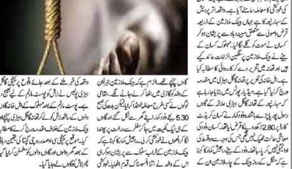
سہ ماہیہ 2222 روپیہ (بی این ایس) پر پیش کر کے قرض سے پریشان ہو کر پھر ایک کسان نے موت کو لگایا گلے۔

سہ ماہیہ 2222 روپیہ (بی این ایس) پر پیش کر کے قرض سے پریشان ہو کر پھر ایک کسان نے موت کو لگایا گلے۔ سہ ماہیہ 2222 روپیہ (بی این ایس) پر پیش کر کے قرض سے پریشان ہو کر پھر ایک کسان نے موت کو لگایا گلے۔ سہ ماہیہ 2222 روپیہ (بی این ایس) پر پیش کر کے قرض سے پریشان ہو کر پھر ایک کسان نے موت کو لگایا گلے۔