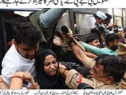
کھنڈر مولائی وکرن آف ایل بیت البتقی ایشیا کی جانب سے 26 مارچ کو سماج کی عید...