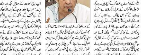
بہ جی میں مجھ سے بحث کرنے کی اہمیت نہیں: مہنتا

بہ جی میں مجھ سے بحث کرنے کی اہمیت نہیں: مہنتا بہ جی میں مجھ سے بحث کرنے کی اہمیت نہیں: مہنتا بہ جی میں مجھ سے بحث کرنے کی اہمیت نہیں: مہنتا بہ جی میں مجھ سے بحث کرنے کی اہمیت نہیں: مہنتا